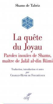
Table ronde en hommage à et en présence de Charles-Henri de Fouchécour, à l'occasion de la parution de sa traduction des Maqâlât de Shams de Tabriz aux éditions du Cerf.