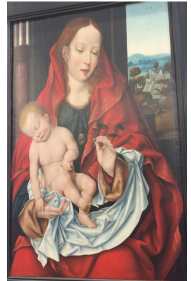
Joos Van Cleve († 1541), Madonna con il bambino, Musei di Strada Nuova, Genoa

La première table ronde aura lieu le lundi 30 septembre 2019 de 18h à 21h - Auditorium