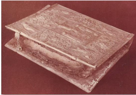
Le manuscrit pourpré de Berat 1 (VI e sc.)

LES MANUSCRITS POURPRÉS DE BERAT ( Beratinus 1 et 2 )