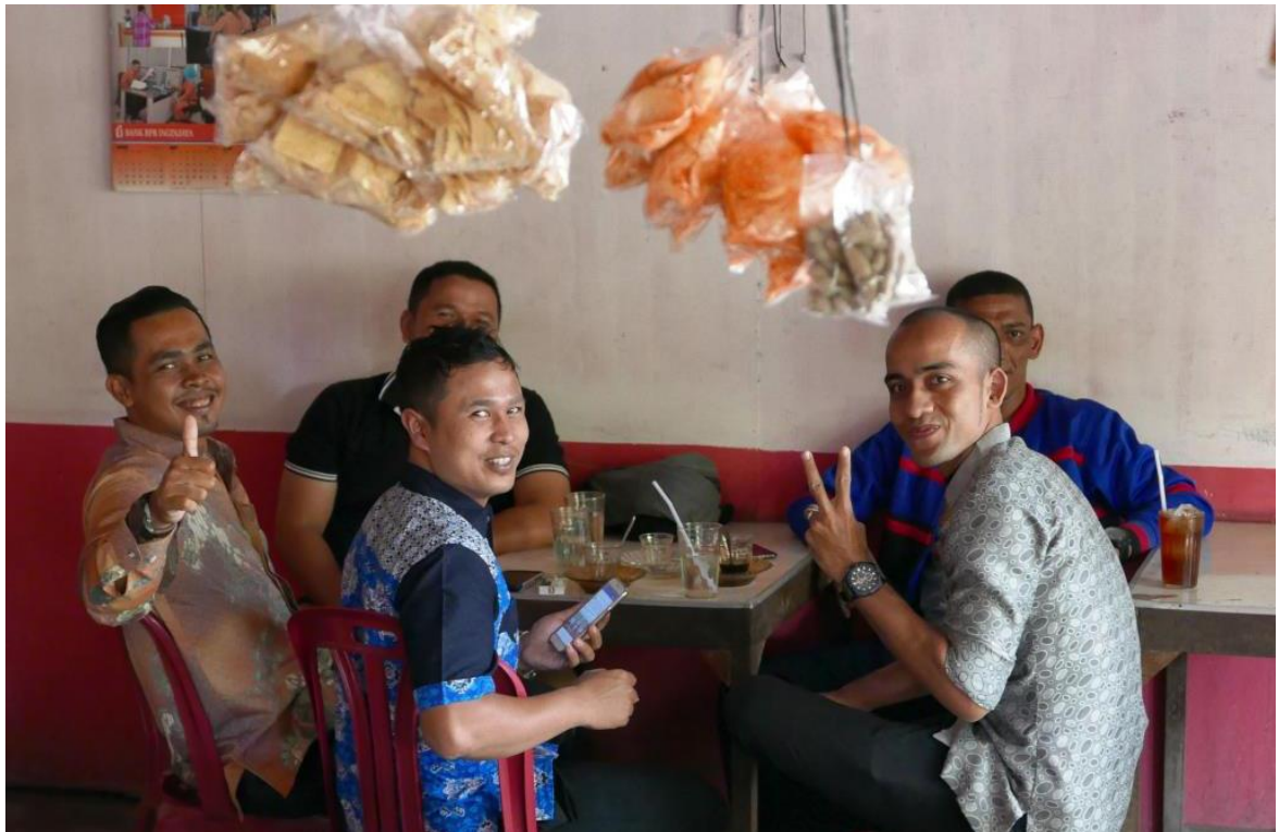
Café à Banda Aceh, province de Nanggroe Aceh Darussalam (JS).