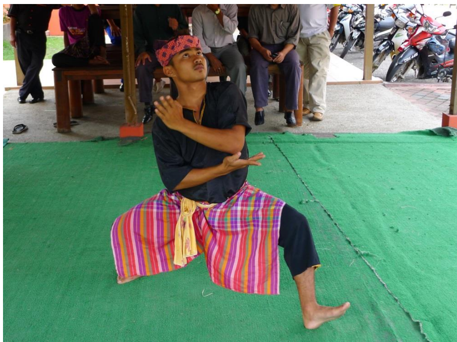
Démonstration de pencak silat à Kota Bahru, état de Kelantan (JS).