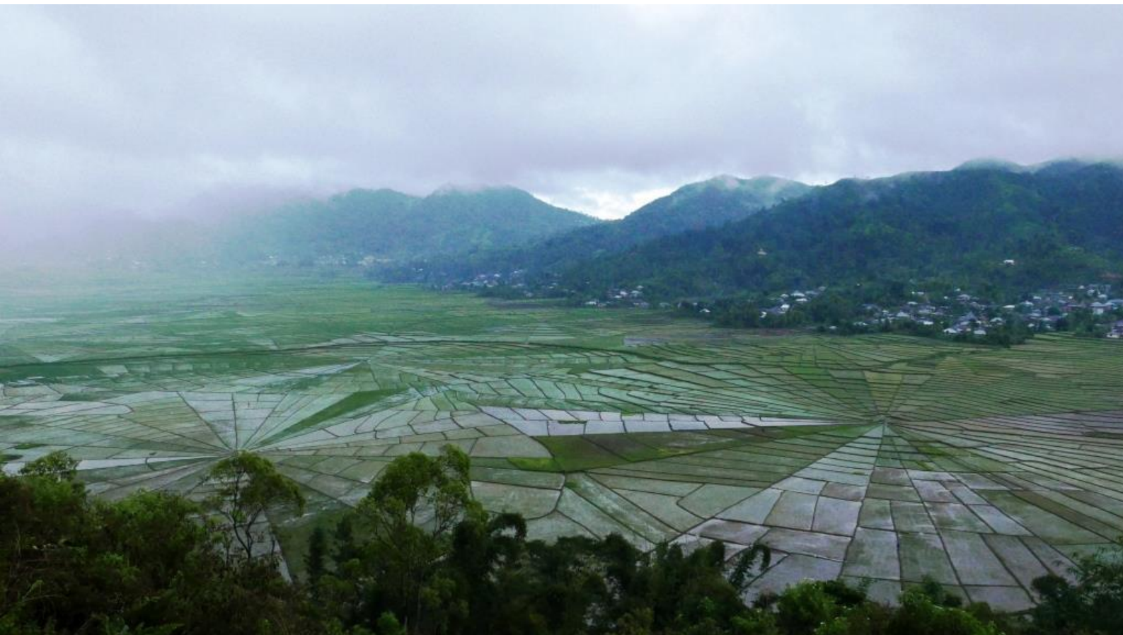
Rizières à Cancar, préfecture de Manggarai, Flores (JS).

http://www.inalco.fr/langue/indonesien-malais