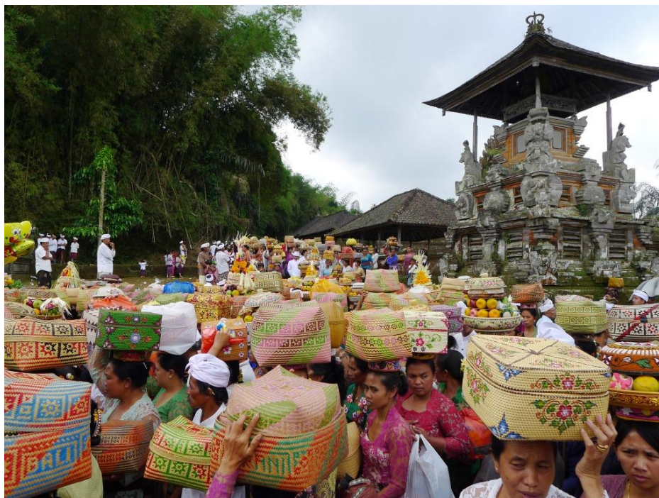
Fidèles au temple d'Apuh, à Bali (préfecture de Gianyar) (JS).

L'offre des enseignements d'approfondissement est donnée en page 12 et détaillée dans la brochure du département Asie du Sud-Est.