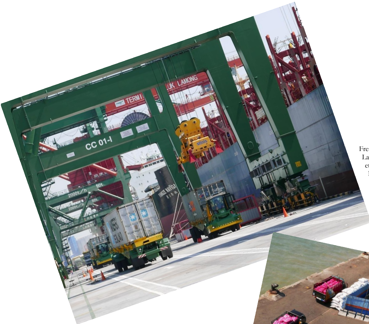
Fret à Tanjung Lamong (G) et à Tanjung Perak (D), Surabaya, province de Java Est (JS).