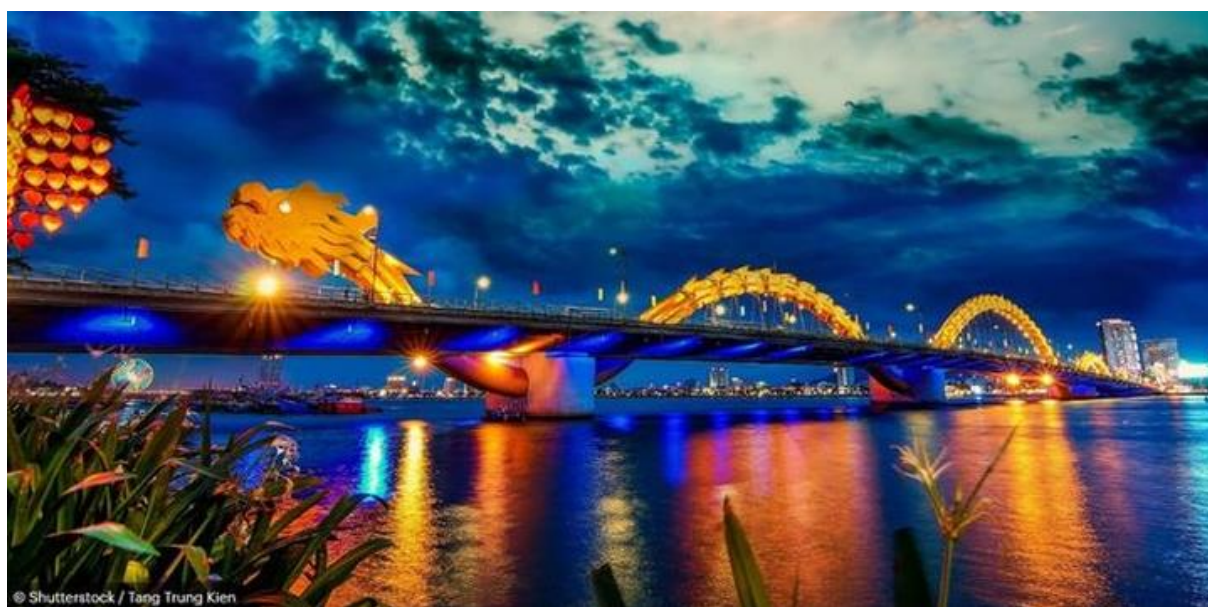
(Pont du Dragon, Da Nang)