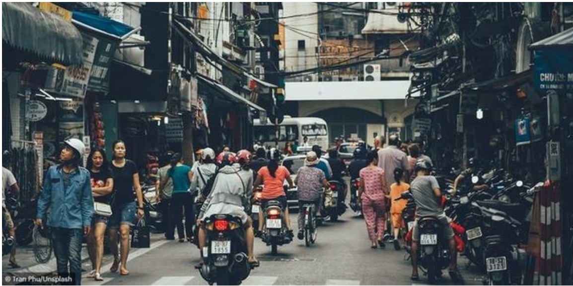
(Une rue à Hanoï)