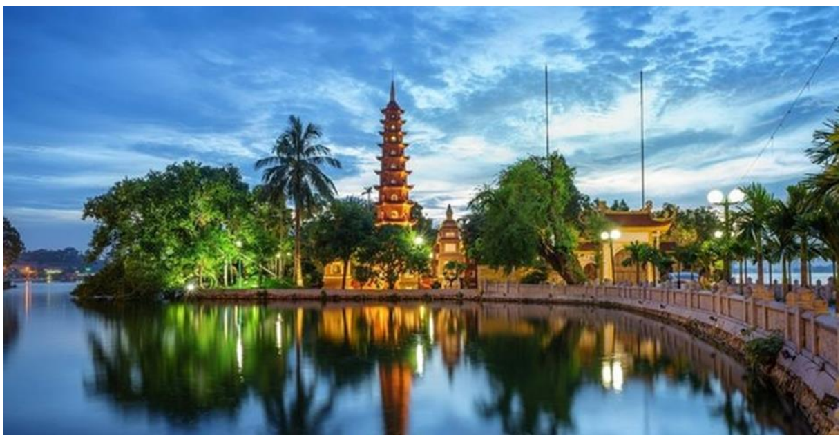
(La pagode de Tran Quoc, Hanoi)

La présente brochure décrit la licence LLCER (« Langues, littératures et civilisations étrangères et régionales ») de vietnamien Pour les diplômes d'établissement, consulter la brochure spécifique disponible sur le site Internet de l'INALCO (page « Formations » du département Asie du Sud-Est et Pacifique).