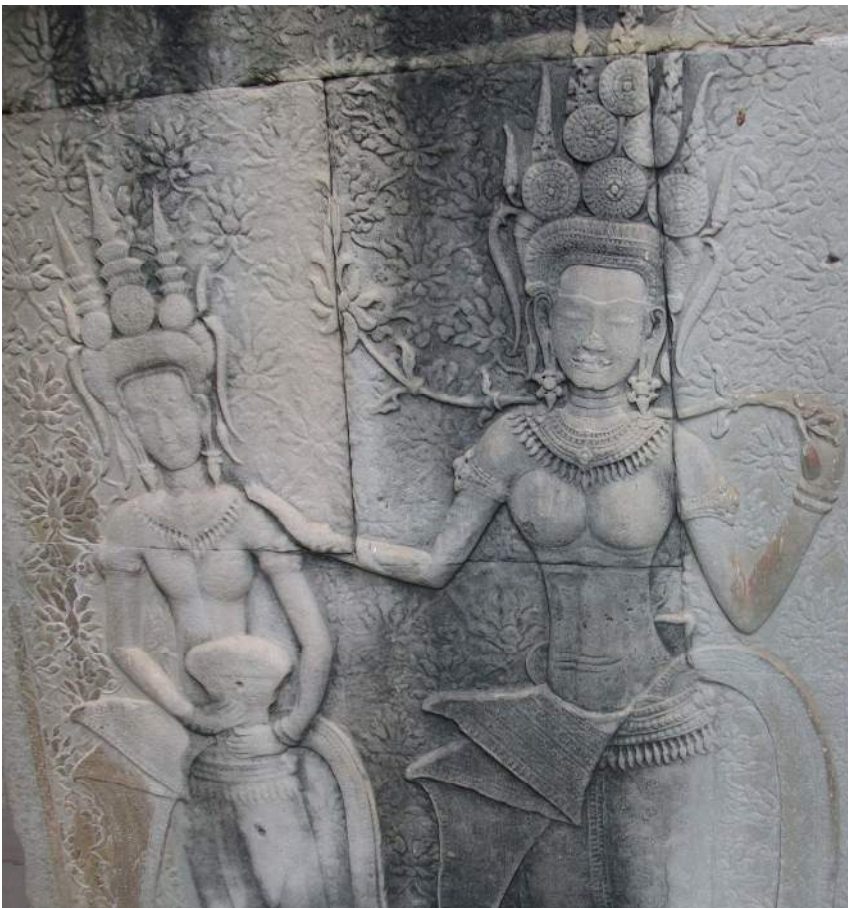
រូបទេពអប្សរ ប្រាសាទអង្គរវត្ត ។