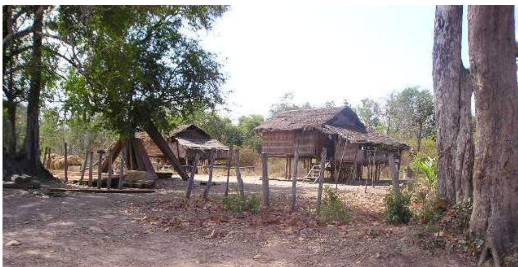
ផ្ទះនៅតាម តំបន់ជនបទ ស្រុកក្តួលៃន ខេត្តព្រះវិហារ ។ Maisons à la campagne, district de Koulen, Province de Preah Vihear (photo : Michel Antelme).