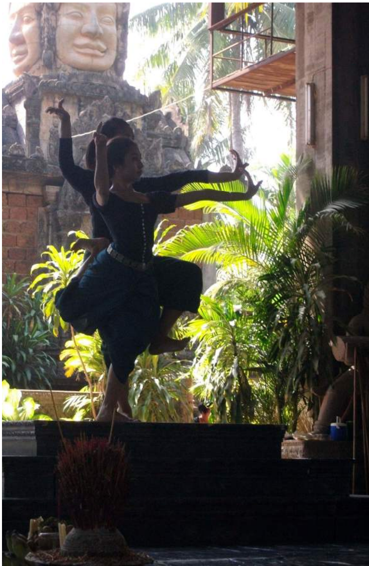
ការហាត់សមរ័ អង្គការសិល្បៈខ្មែរ (សុភីលីន) តាខ្មៅ ខេត្តកណ្តាល ។ Répétition de danse, Sophiline Arts Ensemble, Takhmao, province de Kandal

Dans le cadre des études de licence, l'étudiant acquiert des connaissances approfondies sur les sociétés d'Asie du Sud-Est à travers divers champs disciplinaires (histoire, géographie, littérature, anthropologie, arts) et aborde les grandes problématiques de la région. Il se familiarise enfin avec les outils méthodologiques et disciplinaires nécessaires à certaines pratiques professionnelles et à une poursuite d'études en Master, auquel la licence ouvre de droit.