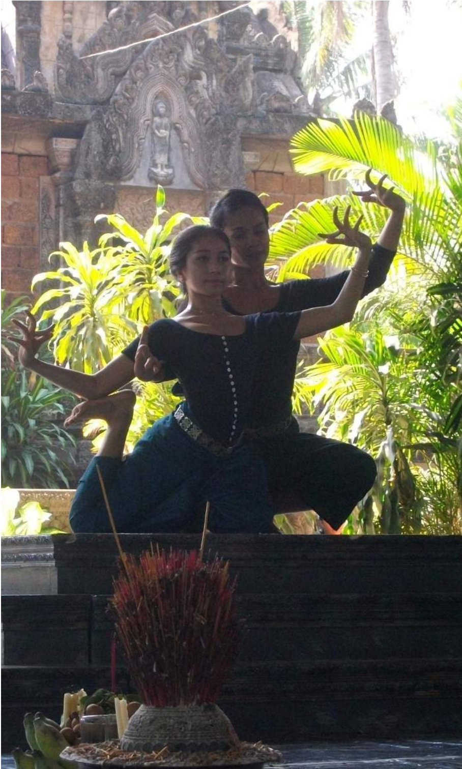
ការហាត់សមរាំ អង្គការសិល្បៈខ្មែរ (សុភីលីន) តាខ្មៅ ខេត្តកណ្តាល ។ Répétition de danse, Sophiline Arts Ensemble, Takhmao, province de Kandal