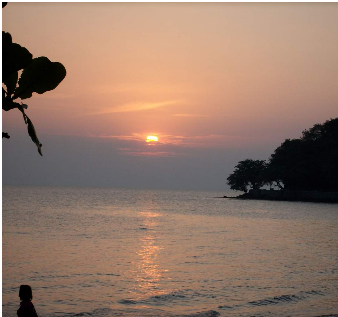
មាត់សមុទ្រ ខេត្តកែប ។ Bord de mer, Kep.

1 ou 2 enseignements (entre 3 et 6 ECTS pour un total de 6 ECTS) à choisir parmi la liste des enseignements de langues et de sciences humaines et sociales de l'INALCO, ou en dehors de l'INALCO.