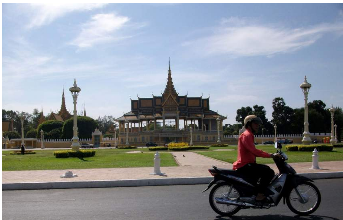
ព្រះទីនាំងចន្ទឆាយា ព្រះបរមរាជវាំង ក្រុងភ្នំពេញ ។ Pavillon Chanchhaya, palais royal de Phnom Penh.