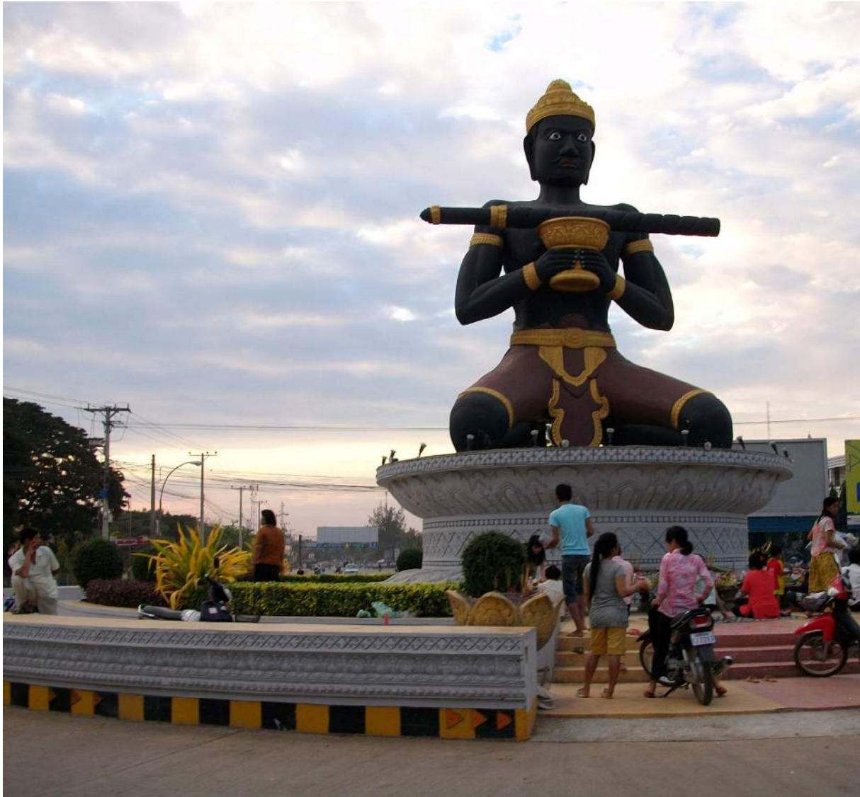
រូបសំណាកលោកតាដំបងគ្រូព្យុង ក្រុងបាត់ដំបង ។