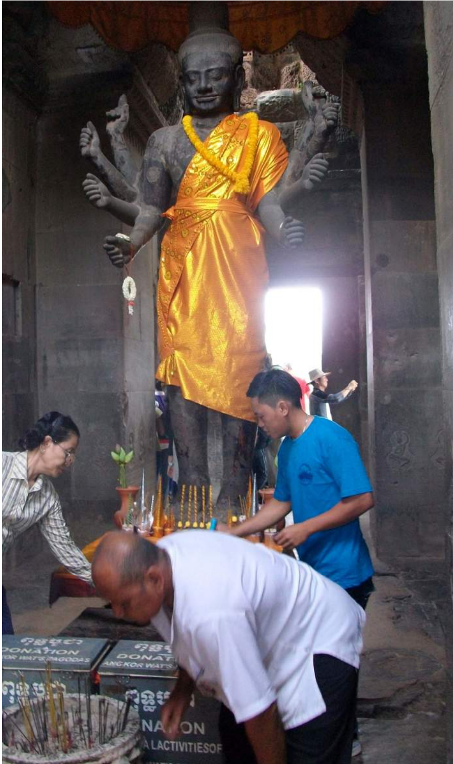
រូបបដិមាតារាជ ប្រាសាទអង្គរវត្ត ។ Statue de Ta Reach, temple d'Angkor Vat.