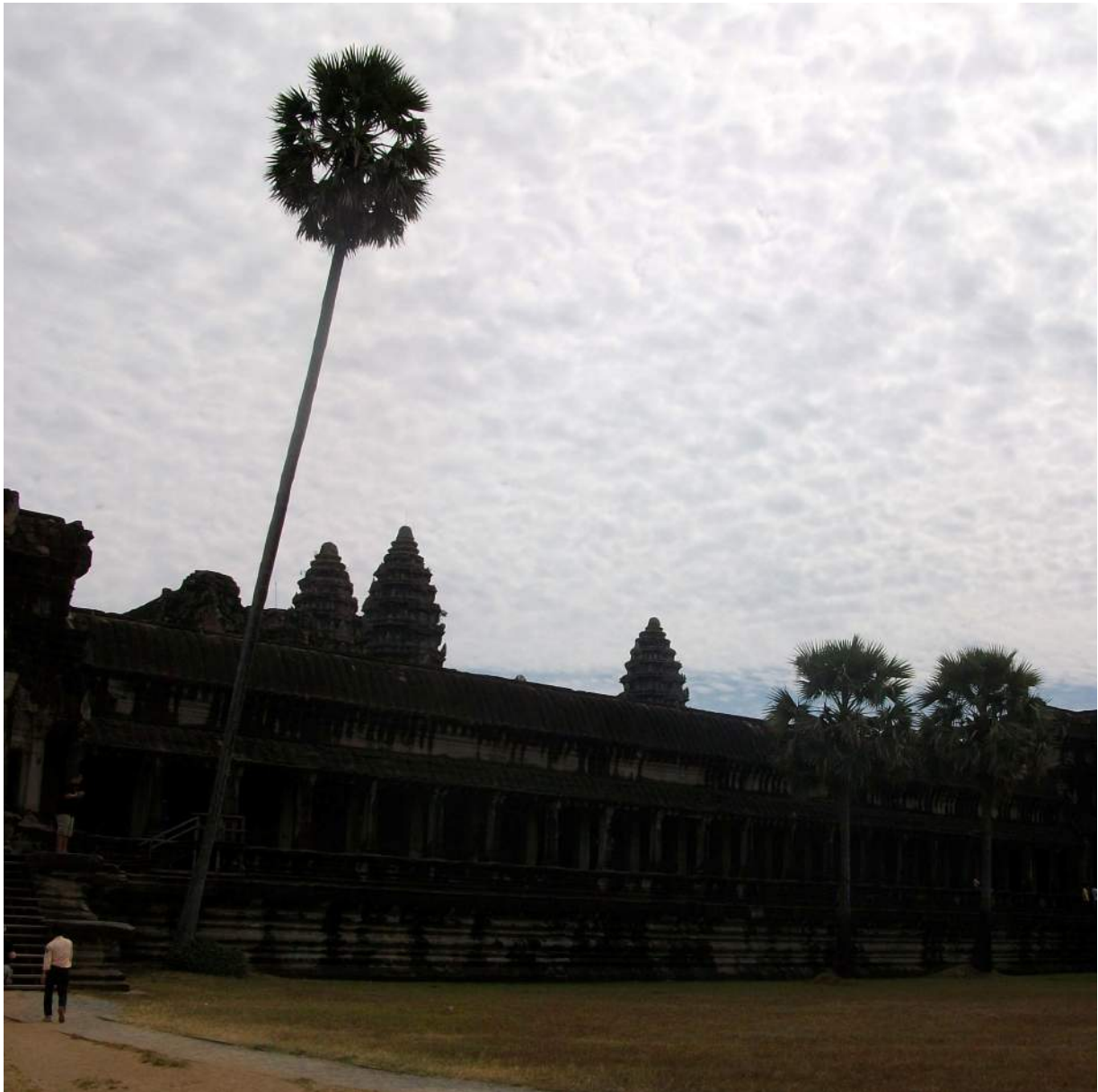
ដើមឆ្នោត ប្រាសាទអង្គរវត្ត ។ Palmier à sucre, Angkor Vat.