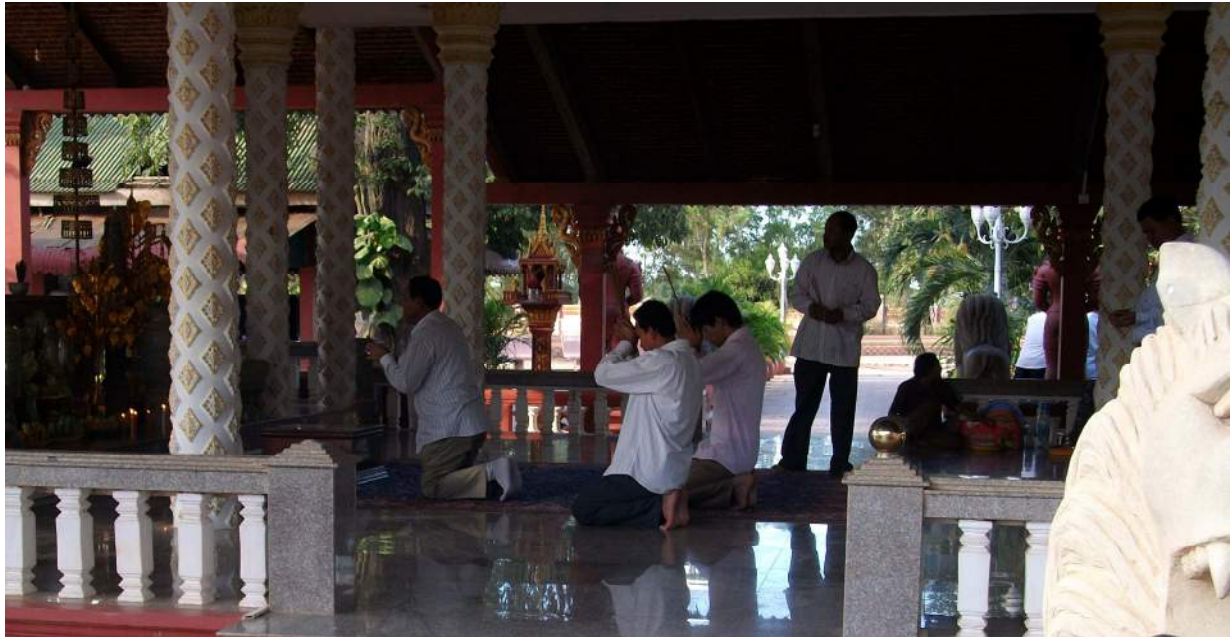
អ្នកស្រុកកំពុងបន់ស្រន់អ្នកតាឃ្លាំងមឿង ខេត្តពោធិ៍សាត់ ។ Prières au génie Khleang Moeung, province de Pursat.