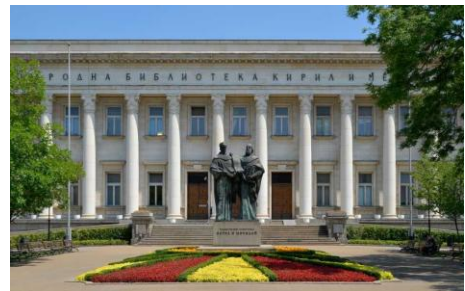
Bibliothèque nationale « Saints Cyrille et Méthode », Sofia.

Au IX e siècle, les événements et la clairvoyance politique de ses souverains ont permis au Royaume de Bulgarie d'accueillir les disciples des frères Cyrille et Méthode, créateurs des alphabets slaves, et d'être ainsi le berceau de la première langue littéraire slave et de la première littérature écrite dans cette langue – faite d'abord de traductions de textes sacrés et liturgiques, puis d'œuvres originales. À partir de là, elles allaient être diffusées en Serbie, dans la Russie de Kiev.