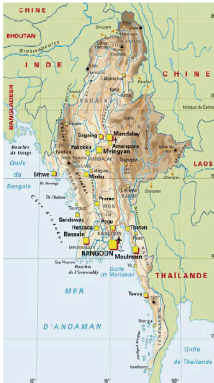
[cf. PopulationData.net : Birmanie]

Brochure non contractuelle, à jour au 23 septembre 2019.