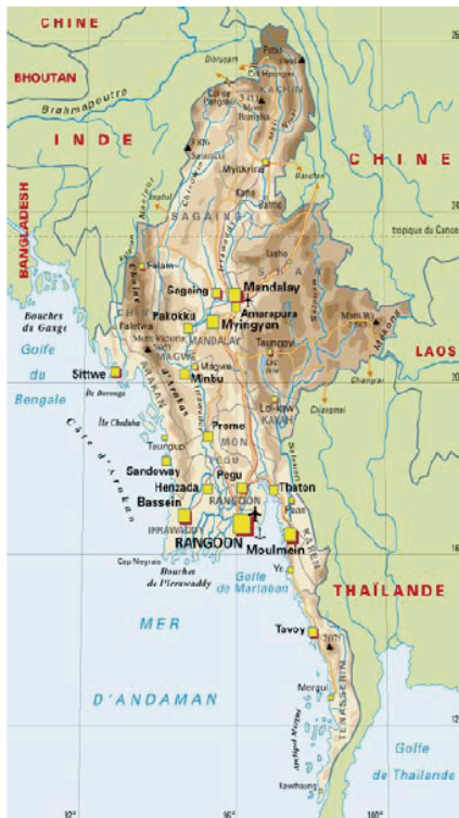
[cf. PopulationData.net : Birmanie]

Brochure non contractuelle, à jour au 23 septembre 2019. Des modifications sont susceptibles d'intervenir.