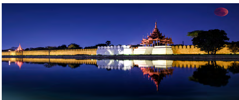
Palais royal de Mandalay