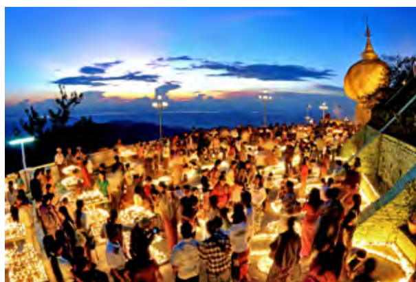
Pagode de Kyaikhtiyo , Rocher d'or, Etat Mon