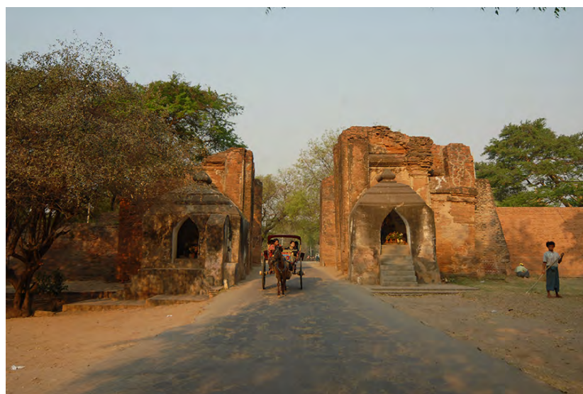
Porte Tharabar : entrée à la vieille capitale de Bagan