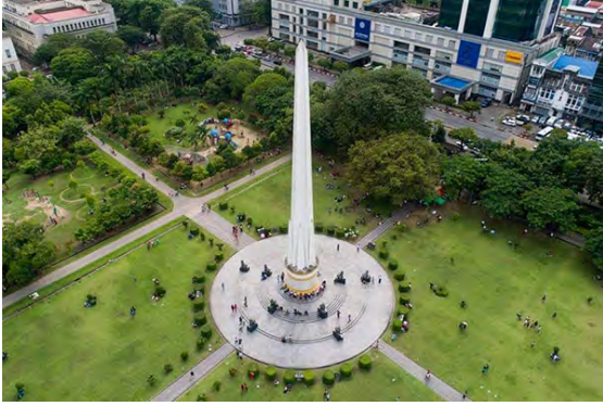
Parc Maha-Bandula, Yangon