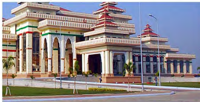
Parlement à Nay Pyi Daw, nouvelle capitale de Birmanie