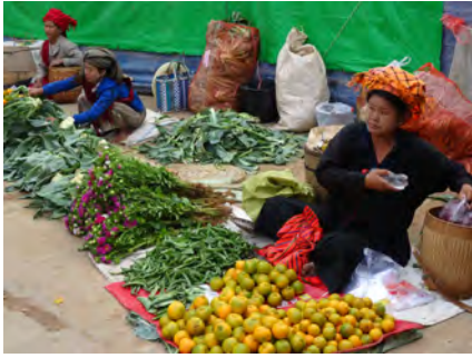
Marché – Etat Shan