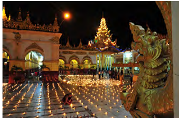
Festival de lumière, Etat Kachin