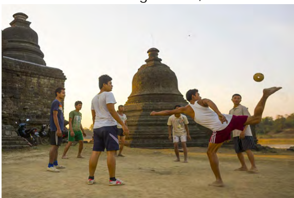
Joueurs de Chinlone