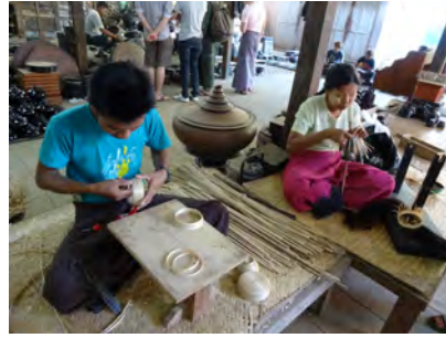
Atelier de laque