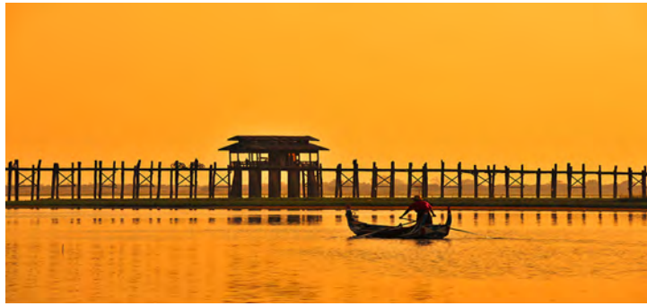
Pont U-Bein , Amarapura