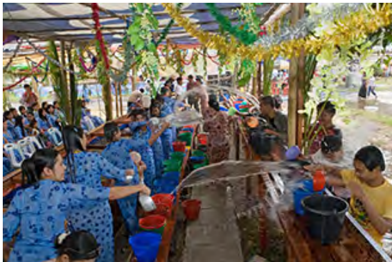
Festival de l'eau rakhine, Etat Rakhine