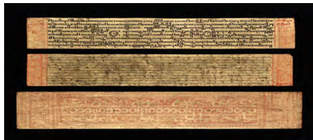
Manuscrit Pali sur feuille de palmier