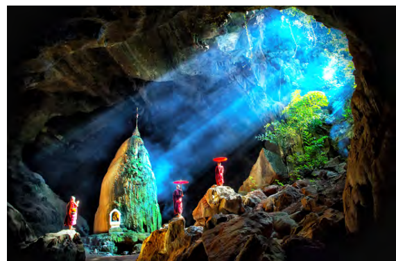
Grotte de Kawgun, Etat Kayin