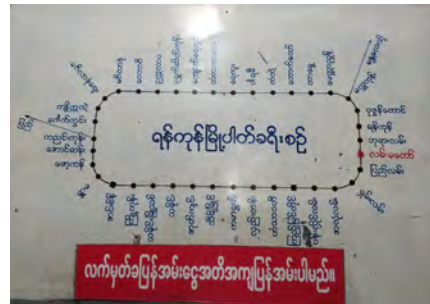
Plan de train local, Yangon : [Photo : R. Arsène-Henry]