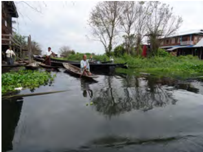
Habitants du Lac Inle