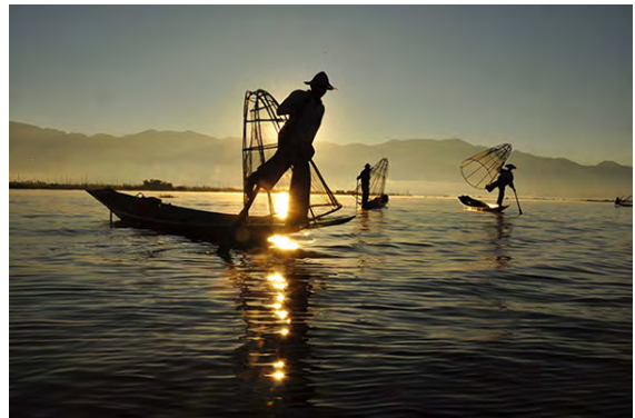
Bâtelier du lac Inle, Etat Shan