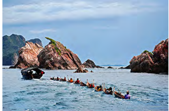
Festival de Salone, région de Myeik