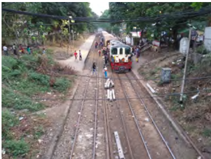
Voyageurs de train