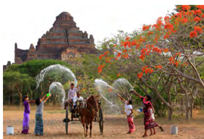
Thagyay : Festival de l'eau au Myanmar (nouvel an birman)