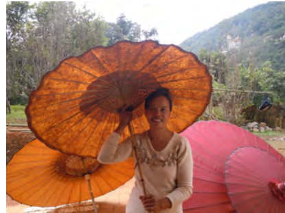
Femme et ombrelles birmanes