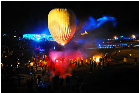
Festival des mongolfières, Etat Shan