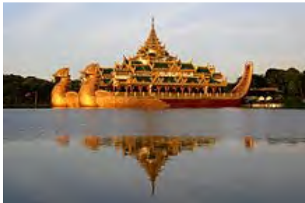
Karaweik Palace, Yangon

Il n'y a pas encore d'associations étudiantes pour les birmanisants, mais c'est à créer. Toutefois, il y a plusieurs sites de réseaux sociaux (Facebook), où l'on peut trouver des échanges informels sur divers sujets concernant la langue birmane et le Myanmar.