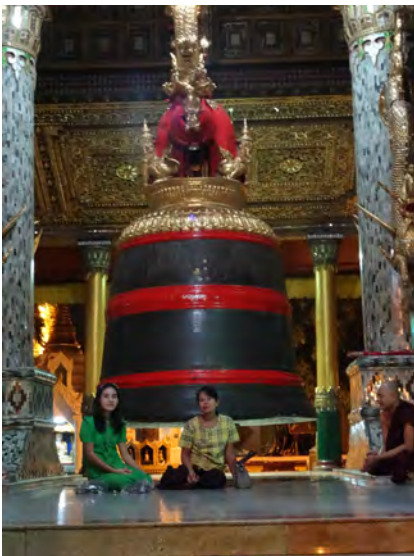
Cloche à la pagode