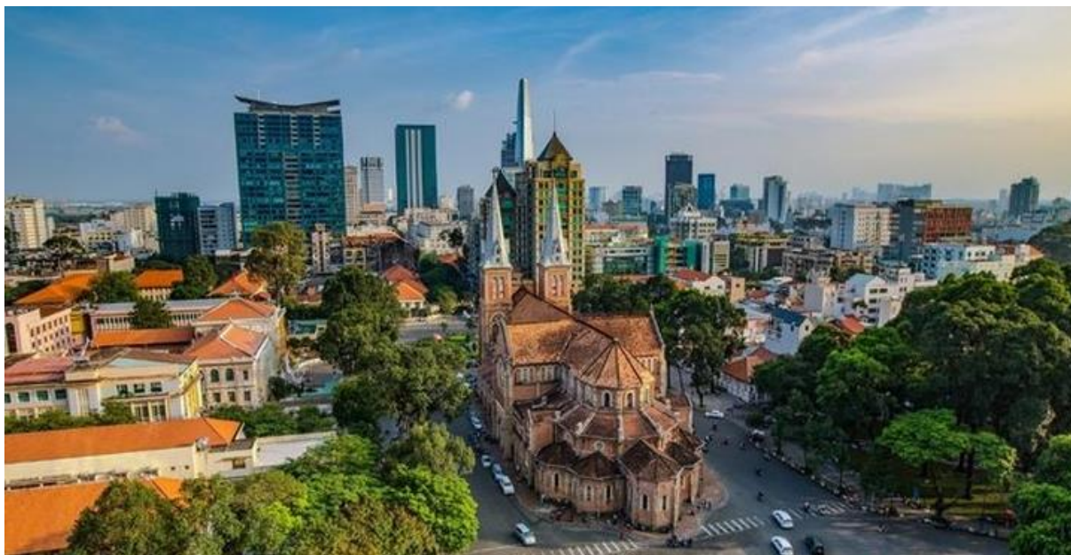
(La Grande Cathédrale au centre de Ho Chi Minh-Ville)