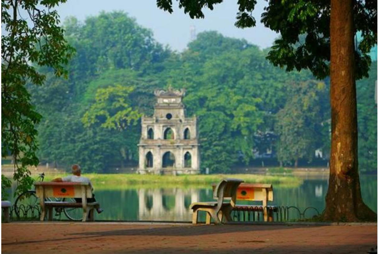
(Tháp Rùa, Hà Nội)