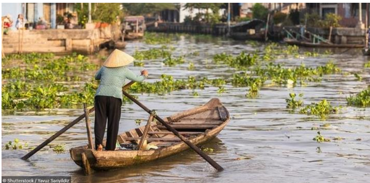
(Le delta du Mékong)