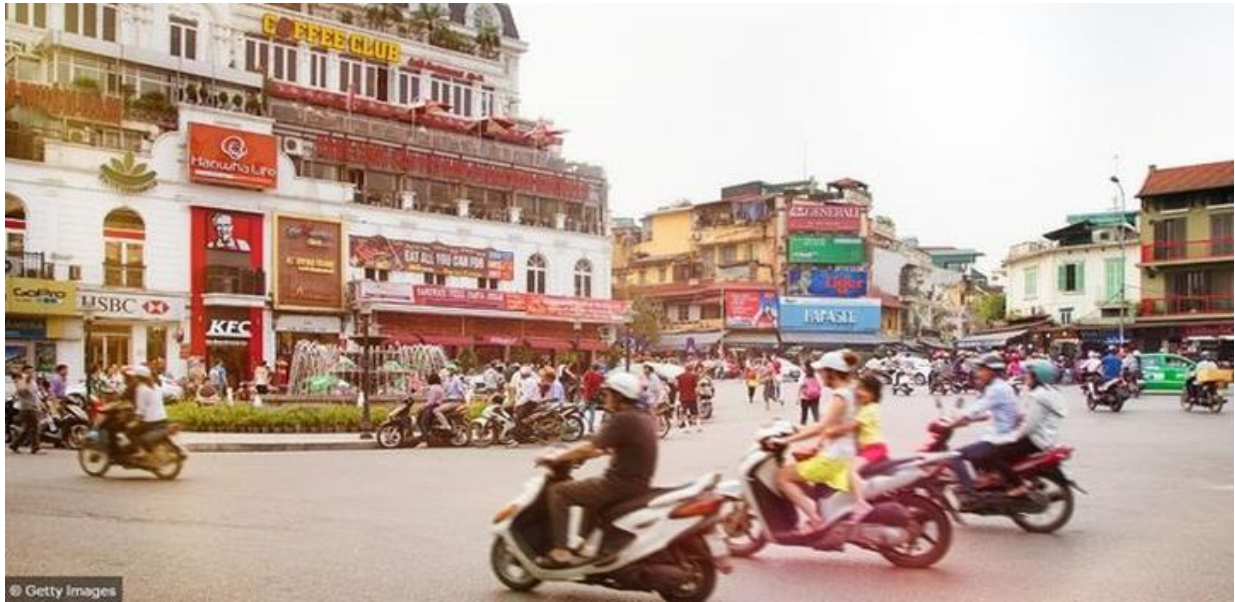
(Au centre de Hanoi)