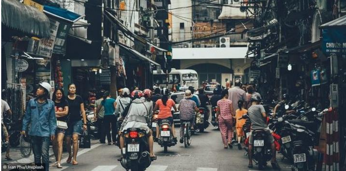
(Une rue à Hanoï)