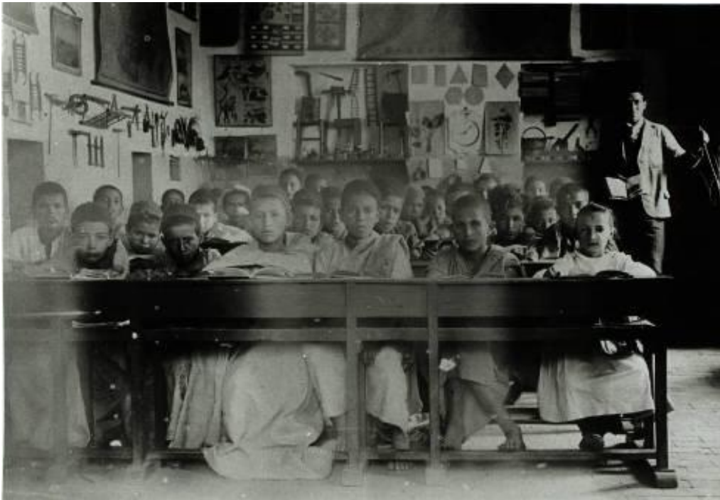
Une classe dans une école de Kabylie (Tamazirt - Irjen, vers 1915).

Brochure non contractuelle, à jour au 14 février 2022. Des modifications sont susceptibles d'intervenir d'ici la rentrée.