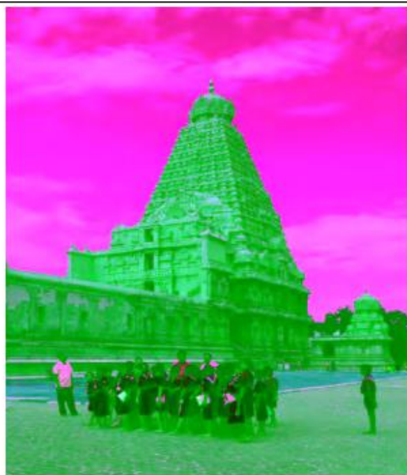
Temple de Bṛhadīśvara, Tañcāvūr (U. Veluppillai, 2014)

Brochure non contractuelle, mise à jour juin 2023