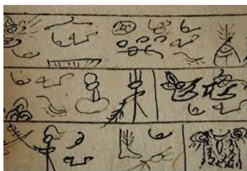
Tablette Naxi en écriture dongba

Principalement destiné aux étudiants des parcours L1+ et Tempo, pour qui l'assiduité est impérative, il accueille cependant chaque année des étudiants de l'Inalco venus de cursus et niveaux variés : toutes les personnes intéressées par la pratique de l'écriture créative sont invitées à prendre contact.