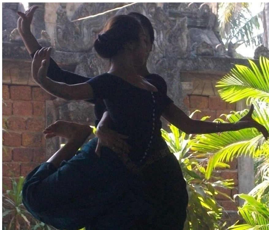
Répétition de danse, Sophiline Arts Ensemble, Takhmao, province de Kandal.

Brochure non contractuelle, mise à jour juin 2023