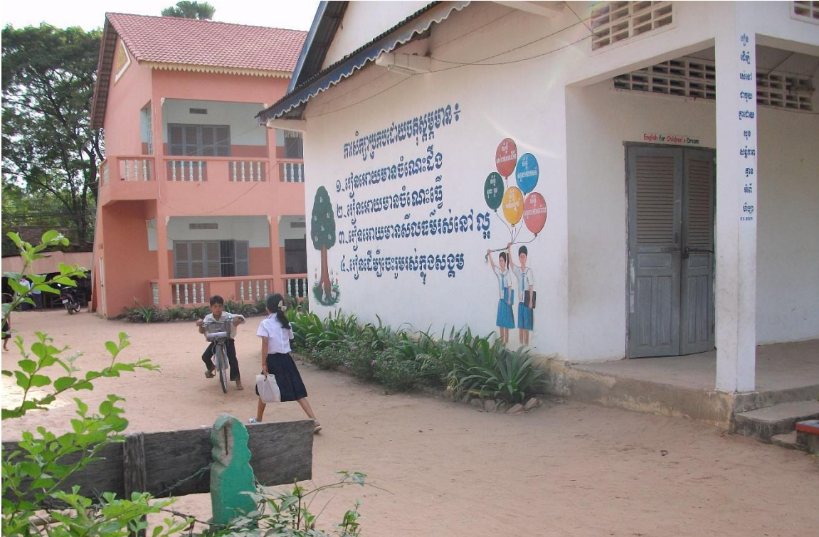
École primaire, ville de Siem Réap.

Vous devez impérativement avoir fait votre inscription pédagogique Ipweb, et activé votre compte numérique étudiant pour pouvoir accéder à la plateforme Moodle.