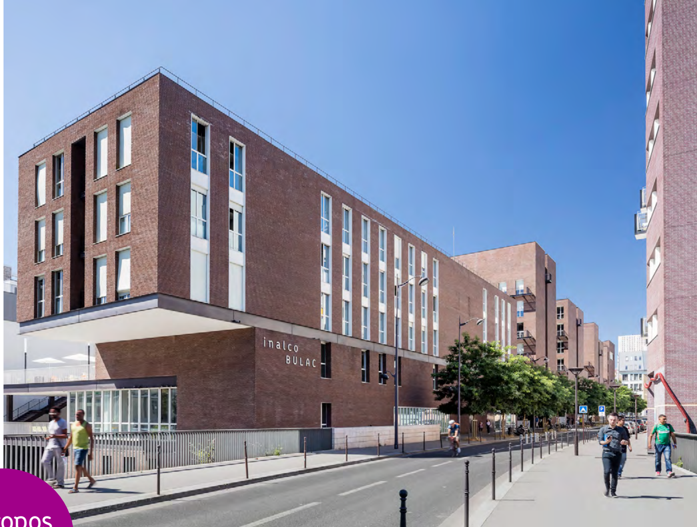
Pôle des langues et civilisations, Paris 13 © Ateliers Lion Associés