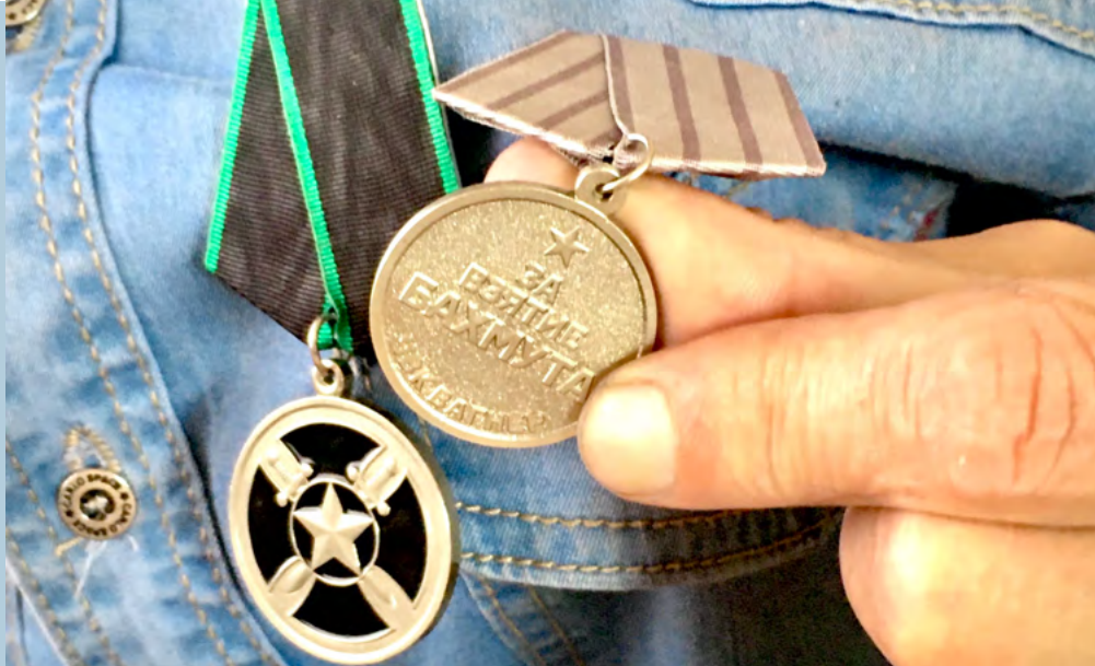
La médaille d'un milicien Wagner de retour de Bakhmout