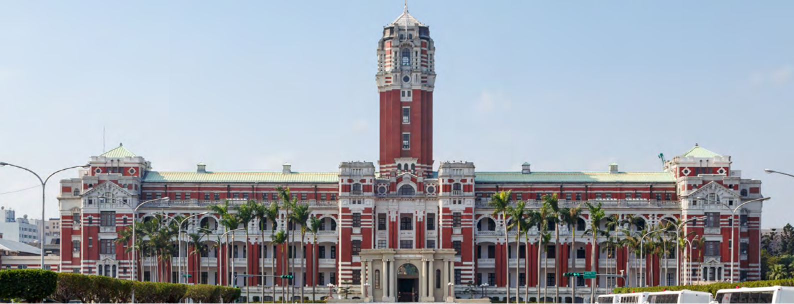
Taipei, Taiwan: Presidential Office Building