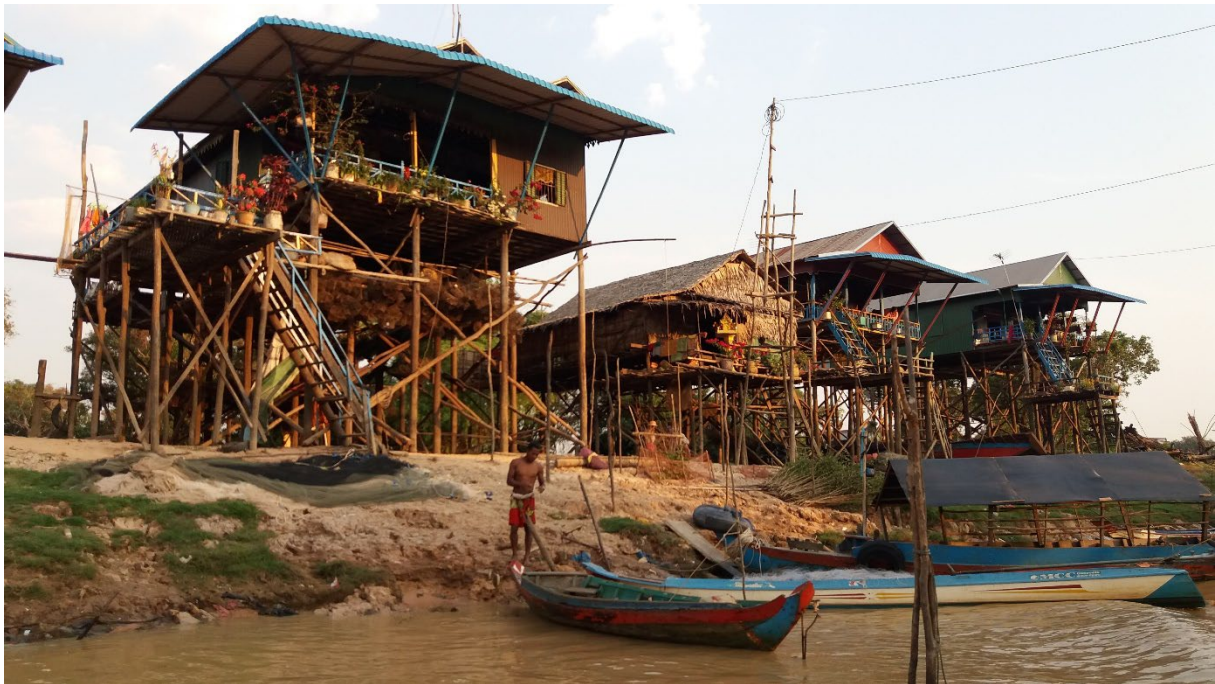
ភូមិកំពង់ភ្នំ ខេត្តសៀមរាប នៅរដូវប្រាំង ។

Une absence justifiée à une épreuve entraîne la note de 0/20, intégrée dans le calcul des moyennes du semestre. Le justificatif d'absence doit être produit auprès du secrétariat pédagogique au plus tard quarante-huit heures après l'épreuve.