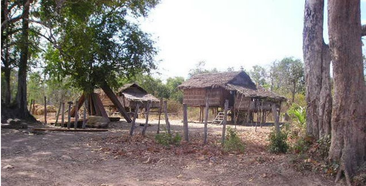
ផ្ទះនៅជនបទ ខេត្តសៀមរាប ។