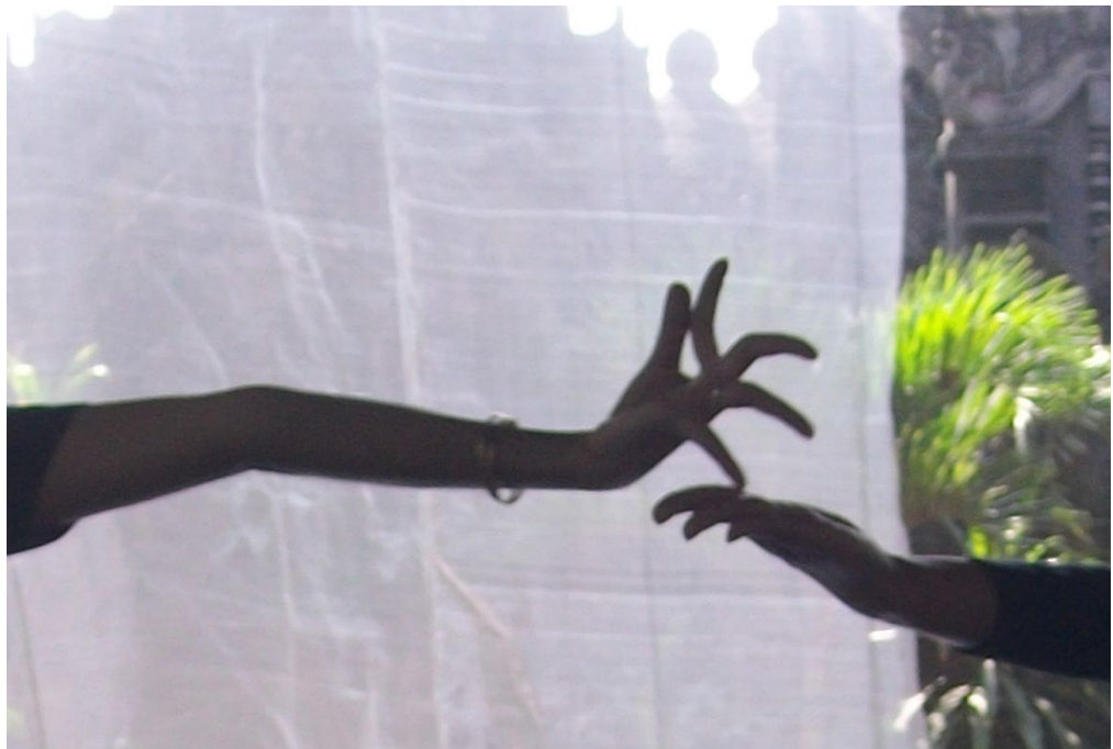
ក្បាច់រាំ អង្គការសិល្បៈខ្មែរ (សុគីលីន) ។ Geste de danse, Sophiline Arts Ensemble.