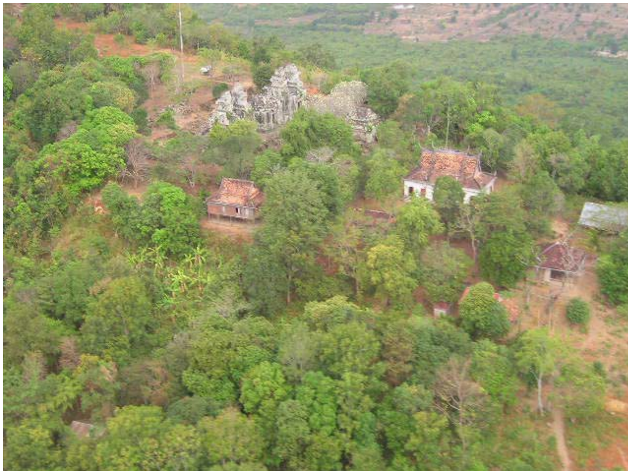
ប្រាសាទសម័យអង្គរ និងវត្តពុទ្ធសាសនាថេរវាទ ។ Temple angkorien et pagode theravādine.