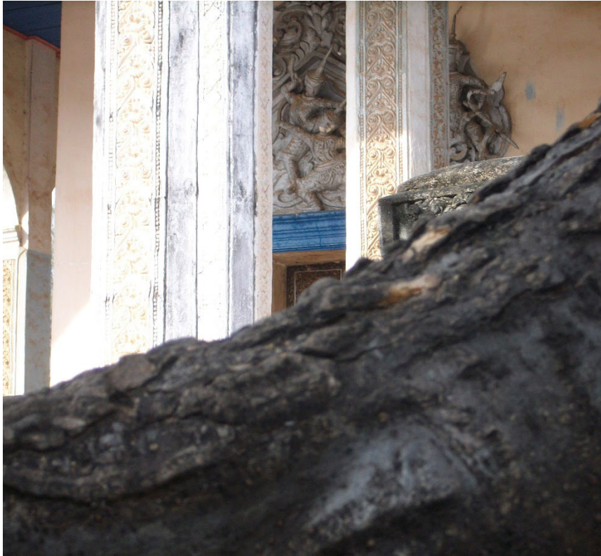
ចម្លាក់រឿងរាមកេរ្តិ៍ វត្តដំរីស ក្រុងបាត់ដំបង ។ Scène du Rāmāyaṇa sculptée, Vat Dâmrei Sâ, Battambang.