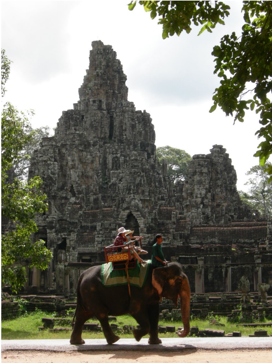
ប្រាសាទបាយ័ន សៀមរាប ។ Temple du Bayon, Siem Reap.