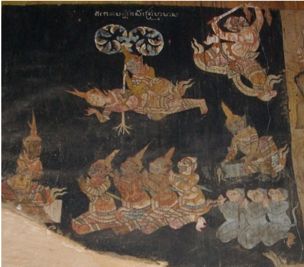
គំនូររឿងរាមកេរ្តិ៍ វត្តរាជបូណ៌ ក្រុងសៀមរាប ។