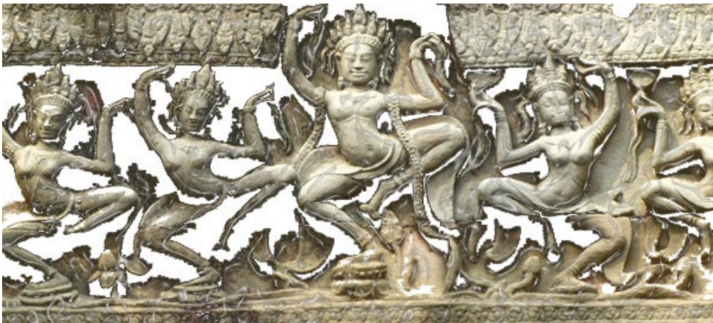
Vat Phnom, Phnom Penh.