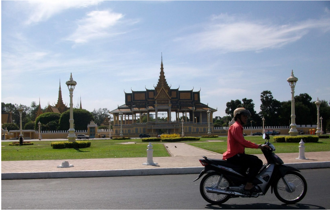
ព្រះទីនាំងចន្ទតាយា ព្រះបរមរាជវាំងបតុមុខ ក្រុងភ្នំពេញ ។ Pavillon Chanchhaya, palais royal de Phnom Penh.