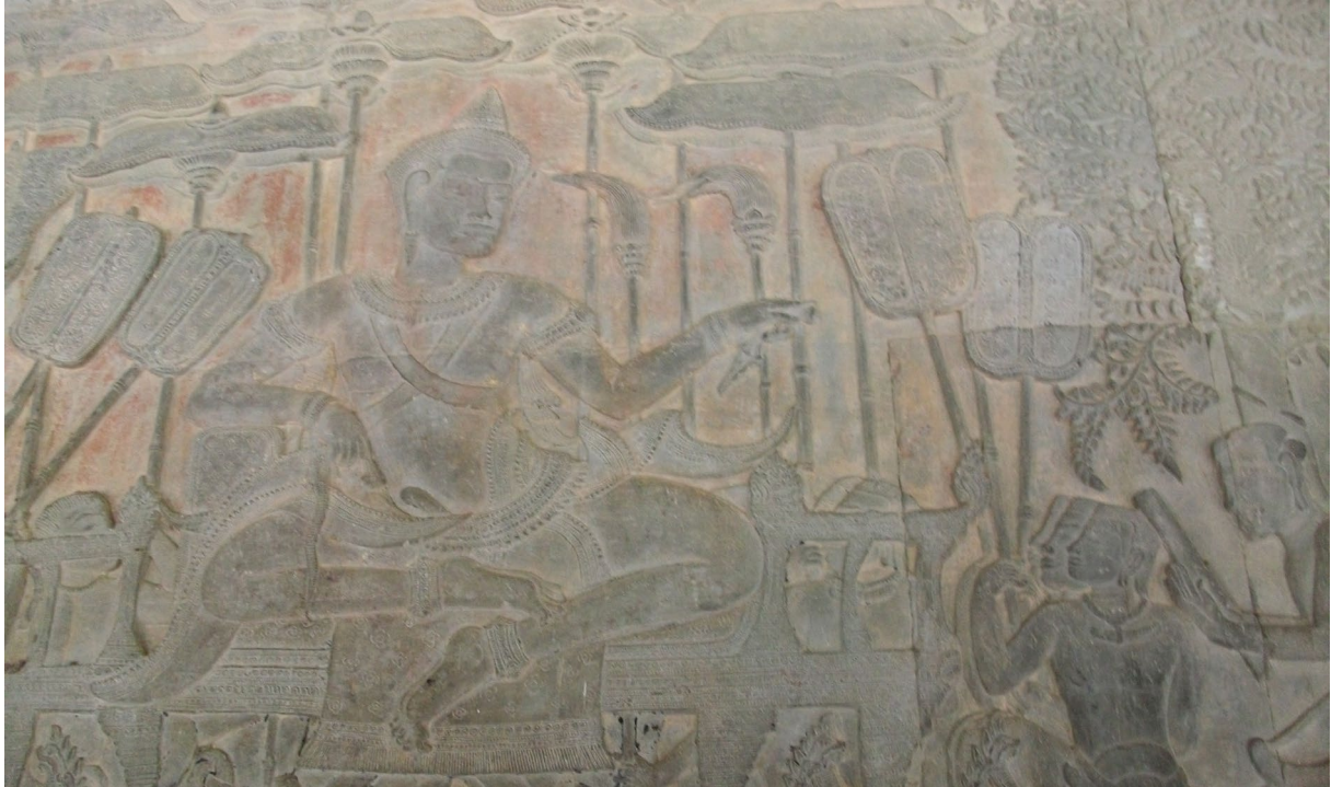
ផ្ទាំងចម្លាក់រូបព្រះបាទសូរ្យវរ្ម័នទី ២ ប្រាសាទអង្គរវត្ត ។ Bas-relief représentant le roi Sūryavarman II, temple d'Angkor Vat.