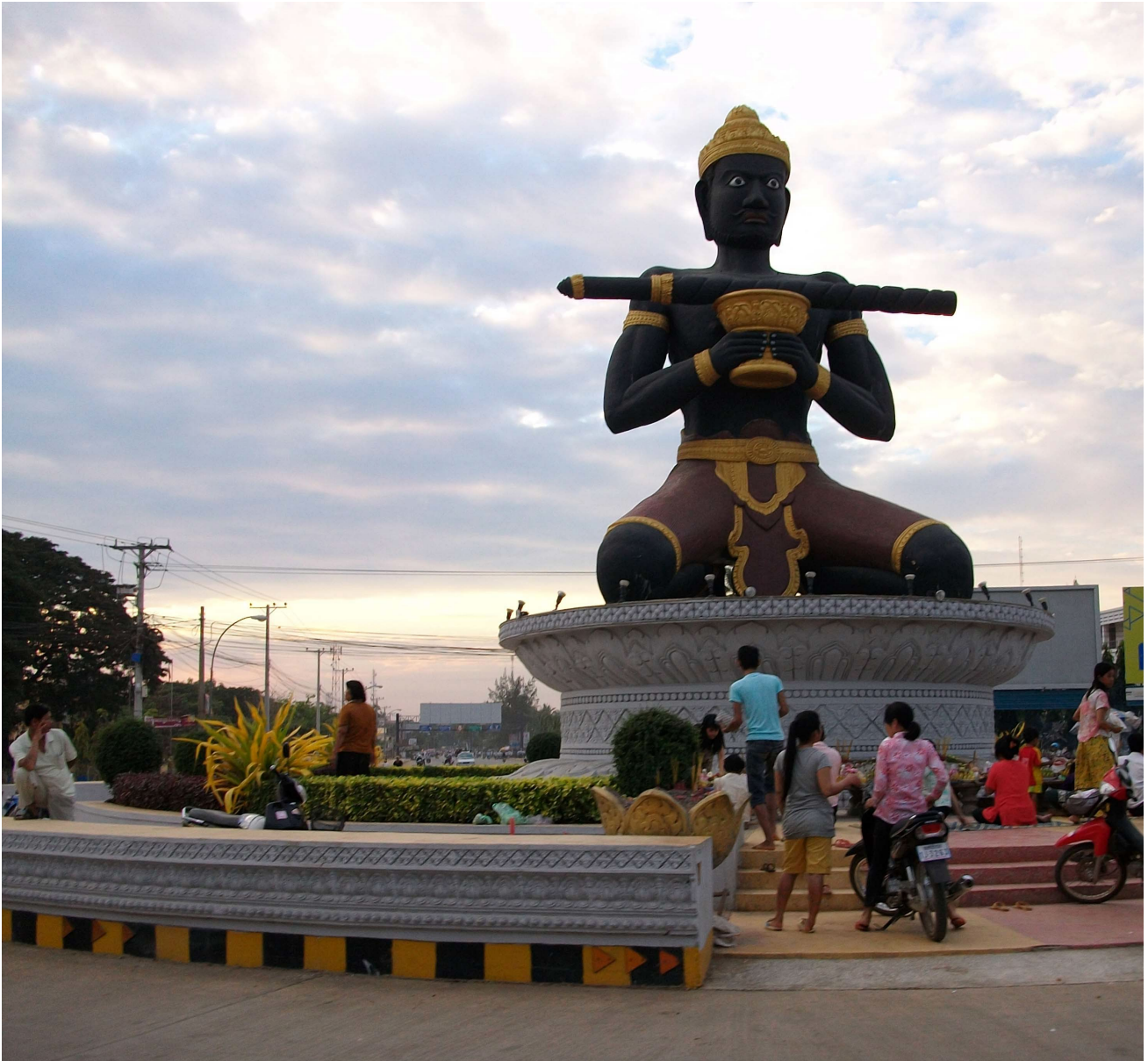
រូបសំណាកលោកតាដំបងគ្រូញង ក្រុងបាត់ដំបង ។ Statue du génie Dâmbâng Kronhoung, ville de Battambang.