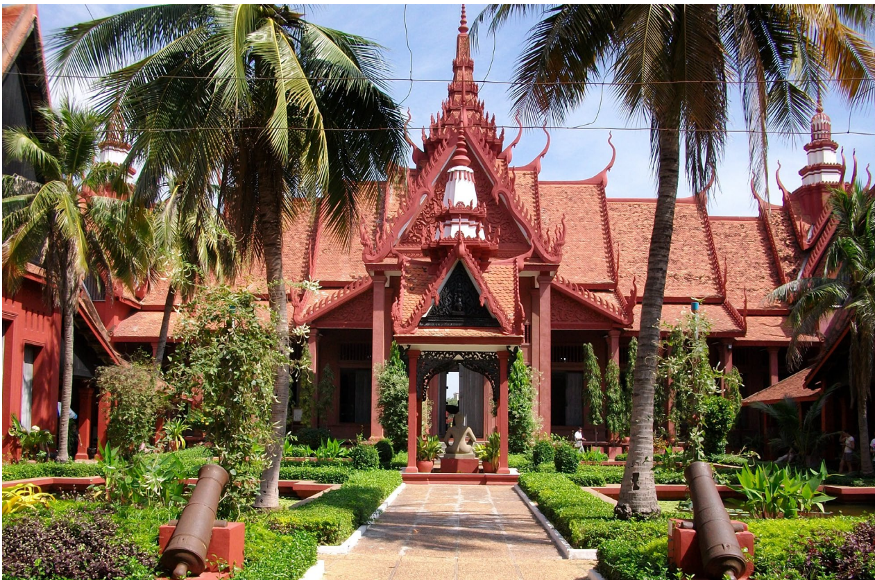
សារមន្ទីរជាតិកម្ពុជា ក្រុងភ្នំពេញ ។