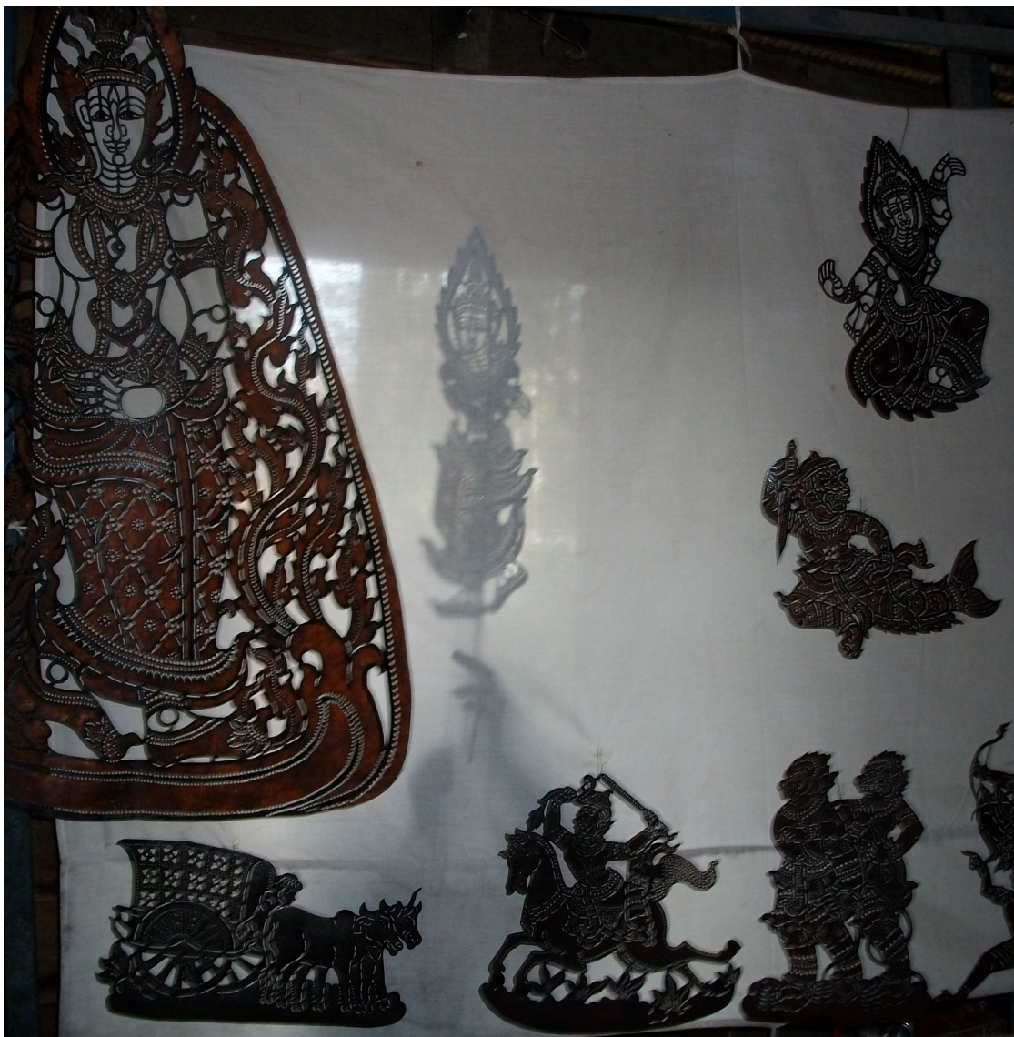
តុក្កតាឈ្មោនស្បែកតូច ក្រុងសៀមរាប ។

Figurines du petit théâtre d'ombres, ville de Siem Reap.