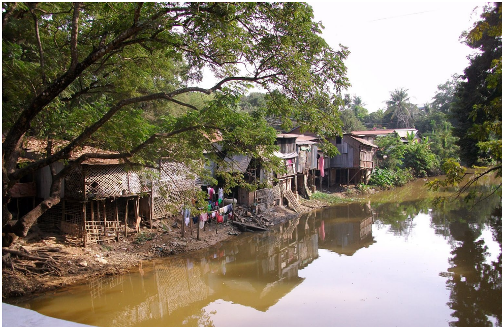
ស្ទឹងសៀមរាប ក្រុងសៀមរាប ។ Rivière de Siem Reap, ville de Siem Reap.

À partir de la L2, les étudiants peuvent bénéficier d'une aide au voyage de l'INALCO, en vue d'effectuer un séjour de perfectionnement linguistique ou d'études dans le pays pendant les vacances universitaires d'été. Cette aide couvre une partie du billet d'avion. Pour plus de renseignements, consulter le site de l'INALCO : http://www.inalco.fr/vie-campus/soutien-accohttps://khmerstudies.org/programs/junior-resident-fellows/ .24mpagnement/bourses-aides-financieres.