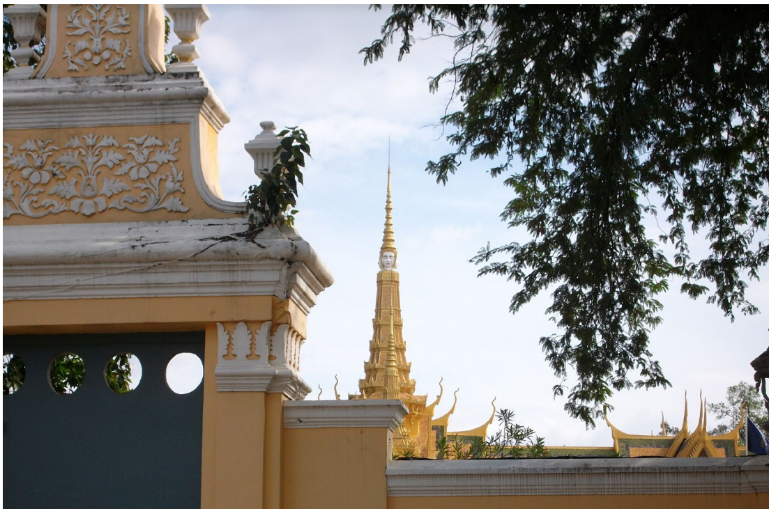
ព្រះបរមរាជវាំងបុរាណ ភ្នំពេញ ។