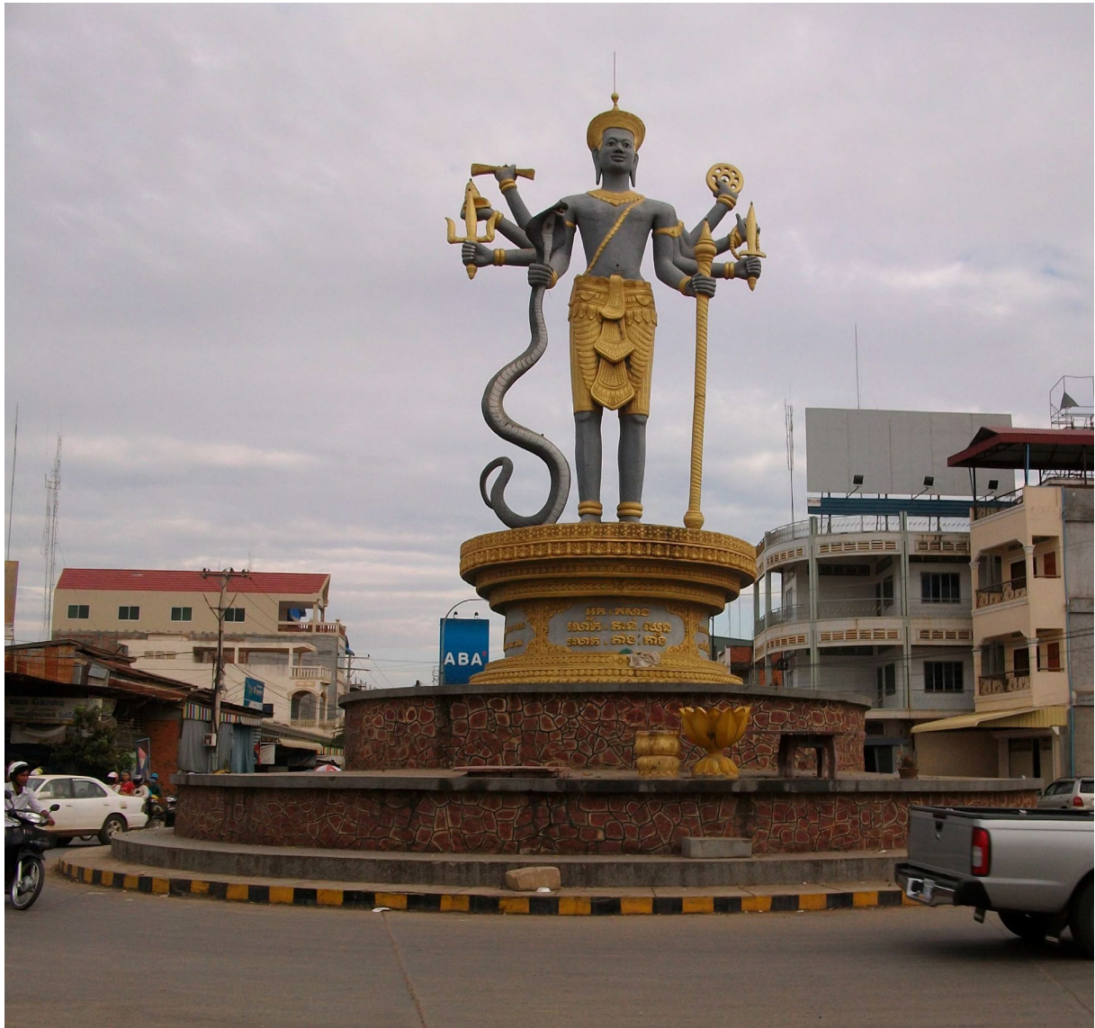
រូបព្រះឥសូរ ទីរួមខេត្តបាត់ដំបង ។