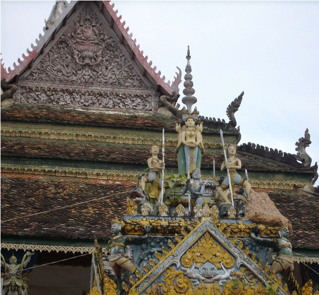
វត្តជំរីស ក្រុងបាត់ដំបង ។

Pagode Vat Dâmrey Sâ, Battambang.