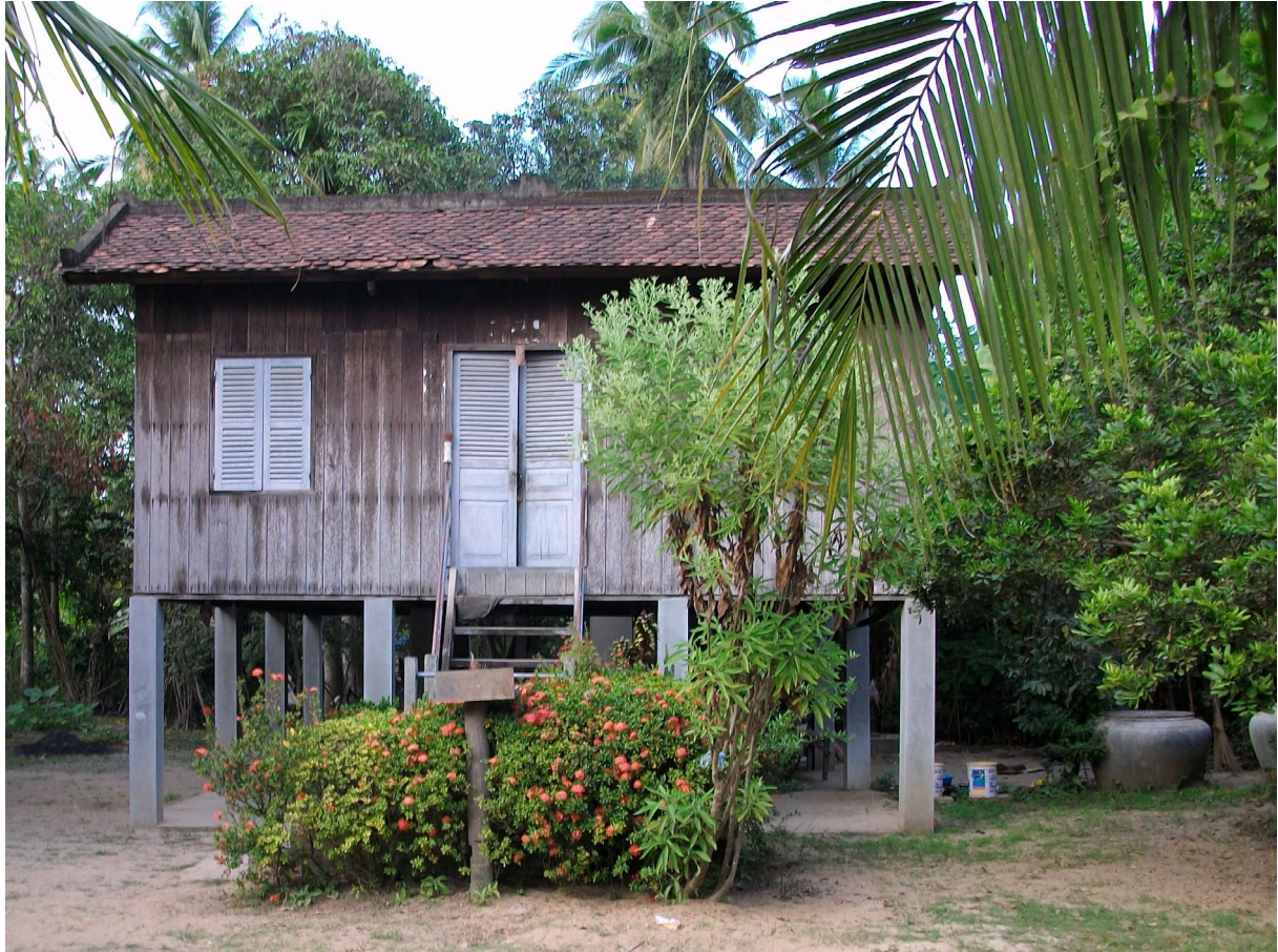
ផ្ទះអ្នកស្រុក ខេត្តពោធិ៍សាត់ ។ Maison villageoise, province de Pursat.

La page L.AS de notre site internet : http://www.inalco.fr/formations/formations-diplomes/accueil-formations-diplomes/licences/licence-las . La page LAS Université de Paris : https://u-paris.fr/l-as-licence-acces-sante/ . Modalités de contrôle des connaissances spécifiques aux LAS : http://www.inalco.fr/formations/formations-diplomes/accueil-formations-diplomes/licences/licence-las .