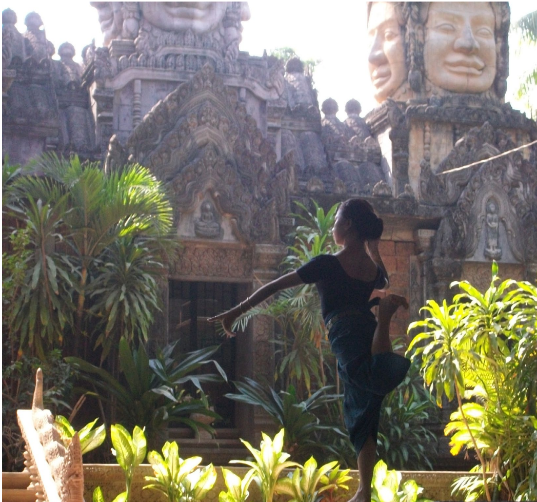
ការហាត់សមរំ អង្គការសិល្បៈខ្មែរ (សុភីលីន) តាខ្មៅ ខេត្តកណ្តាល ។

Brochure non contractuelle, mise à jour du jeudi 6 juillet 2023. Des modifications sont susceptibles d'intervenir d'ici la rentrée.