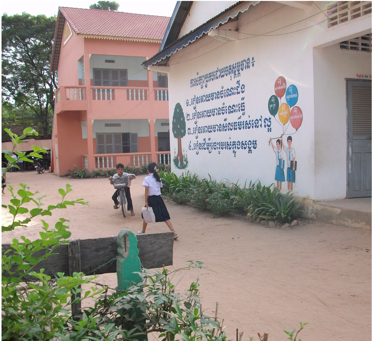
សាលារៀនបឋមសិក្សា វត្តព្រះឥន្ទកោសិយ៍ ក្រុងសៀមរាប ។ École primaire, pagode Vat Preah Enkosey, ville de Siem Reap.