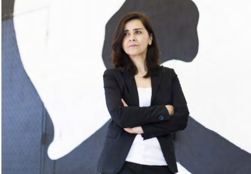
Portrait Négar Djavadi