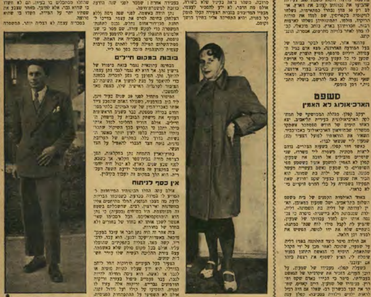
Rina Nathan - Israel's first known transgender woman