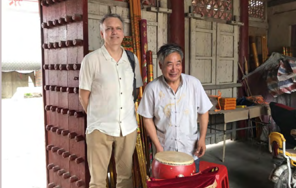
The Extraordinary Ordinary, Consequential Buddhist Patterns to Huaihai Region History, circa 1880-1960