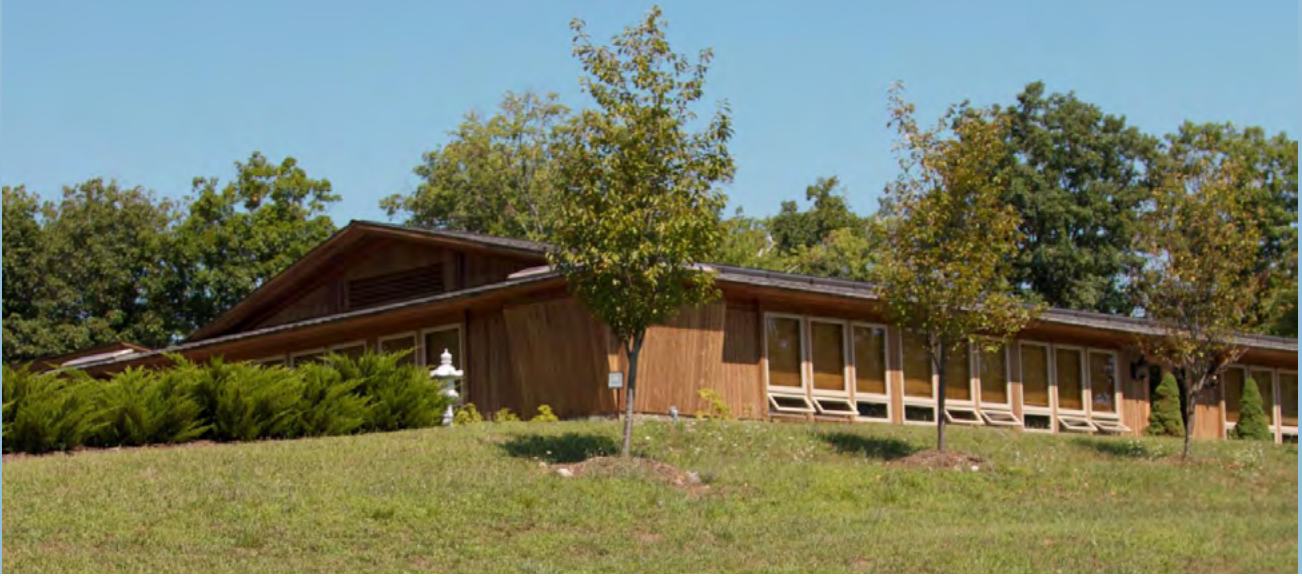
Dharma Drum Retreat Center