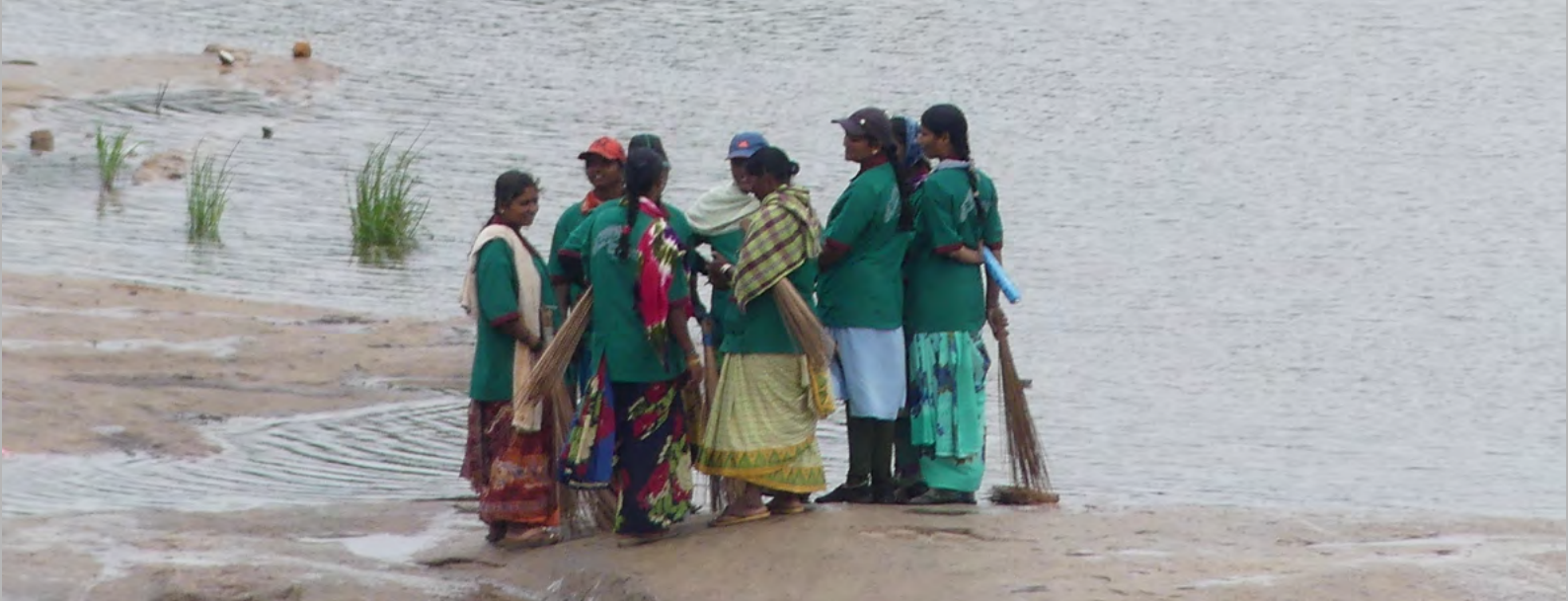
Groupe de femmes se rendant à leur travail (Karnataka, 2023)