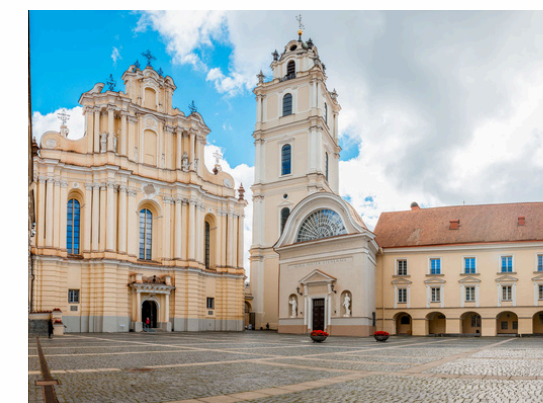
Université Vilnius Vilnius - Lituanie