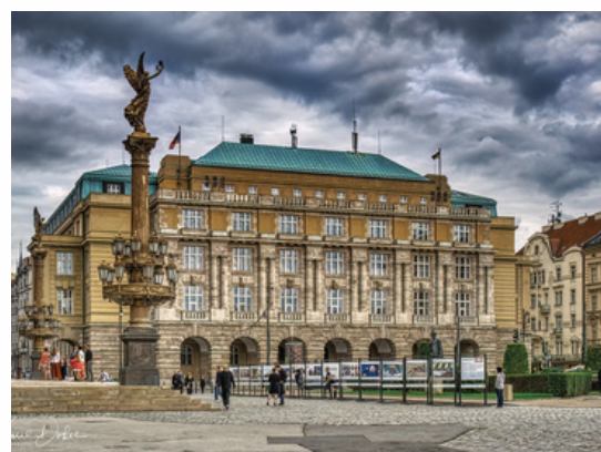
Université Charles Prague - République tchèque