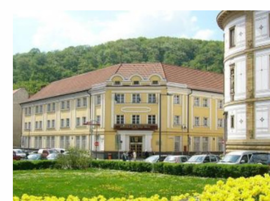
Université Matej Bel Banska Bystrica - Slovaquie