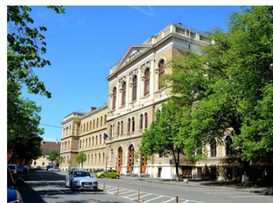
Université Babes-Bolyai Cluj-Napoca - Roumanie