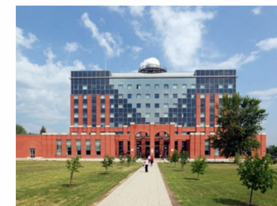
Université Eötvös Lorand Budapest - Hongrie