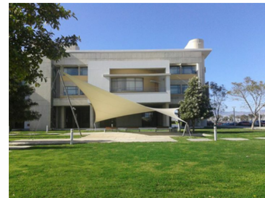
Université de Chypre Nicosie - Chypre