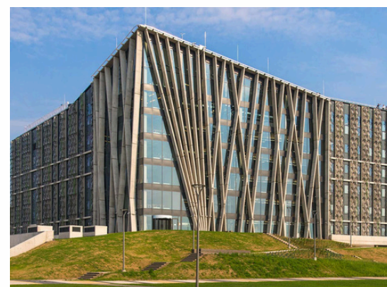
Université de Lettonie Riga - Lettonie