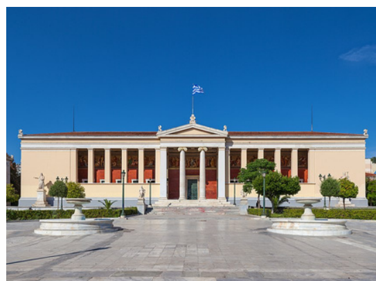
Université Kapodistrienne Athènes - Grèce