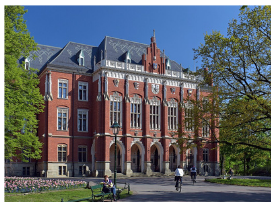
Université Jagellone Cracovie - Pologne