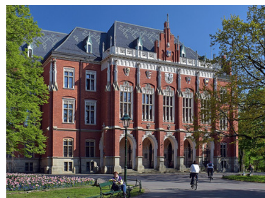
Académie de la culture Riga - Lettonie