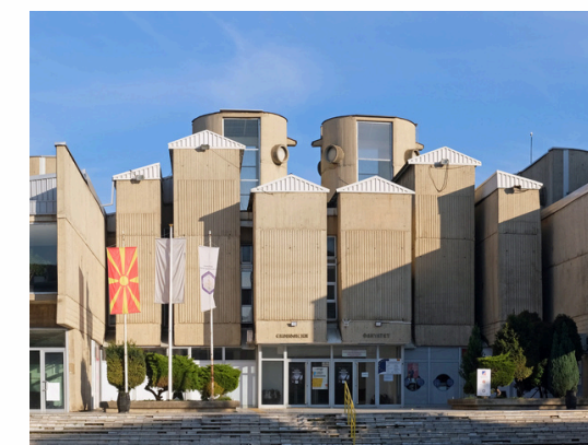
Université Sts Cyrille et Méthode Skopje - Macédoine du Nord