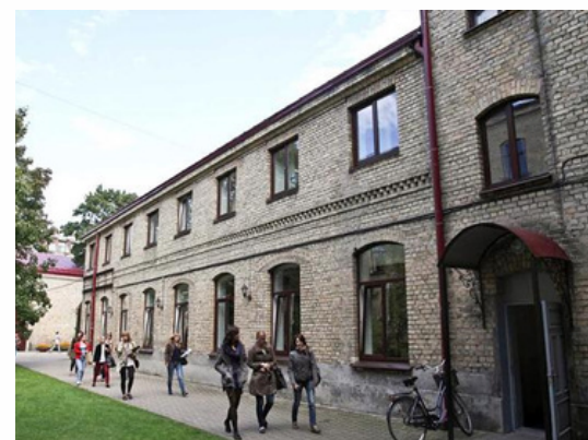
Université Vytautas Magnus Kaunas - Lituanie