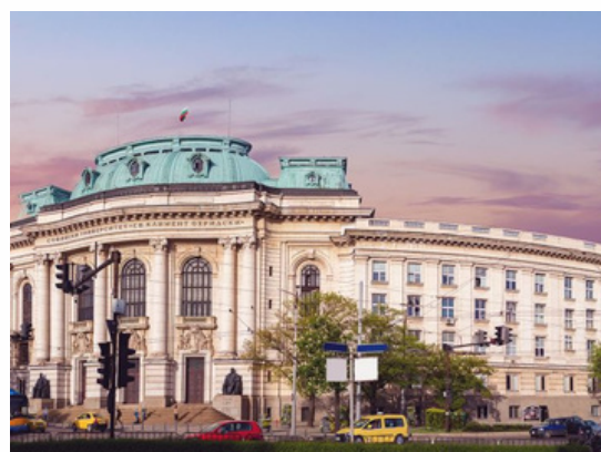
St Kliment Ohridski Sofia - Bulgarie