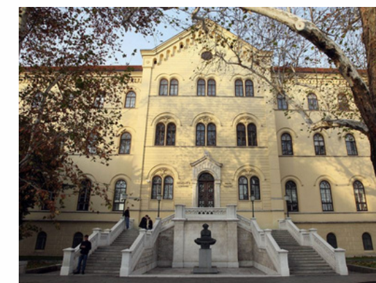
Université de Zagreb Zagreb - Croatie