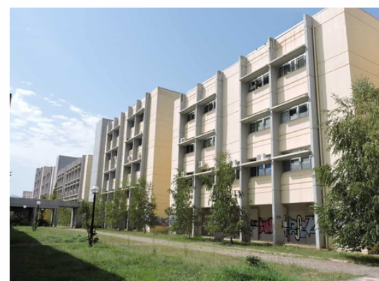
Université Aristote de Thessalonique Thessalonique - Grèce