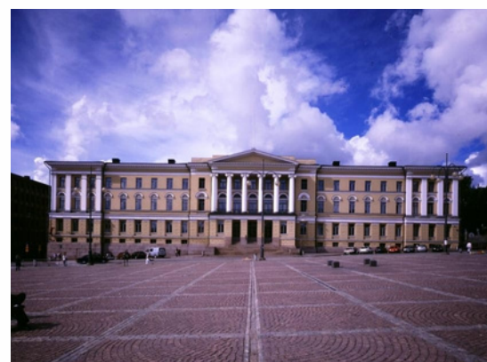
Université de Helsinki Helsinki - Finlande