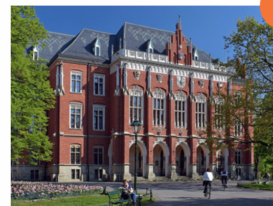
La Sapienza Rome - Italie