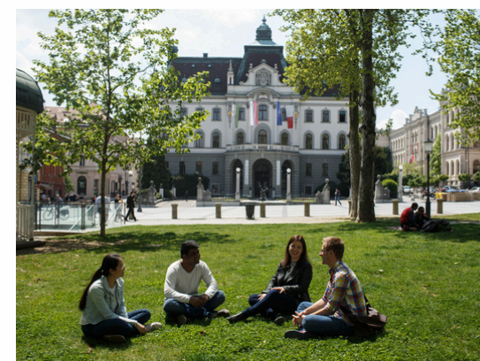
Université de Ljubljana Ljubljana - Slovénie