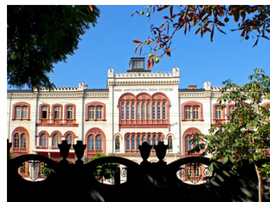
Université de Belgrade Belgrade - Serbie