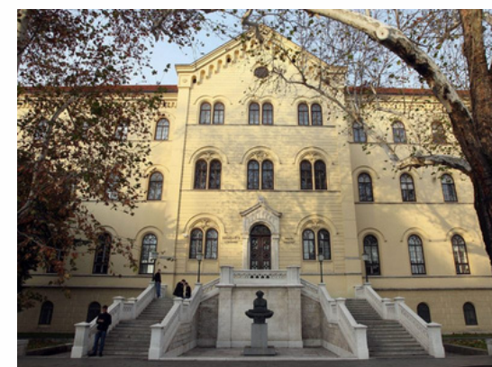
Université de Zagreb Zagreb - Croatie