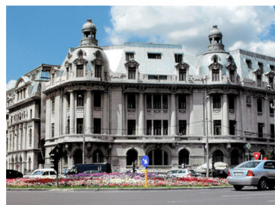
Université de Bucarest Bucarest - Roumanie