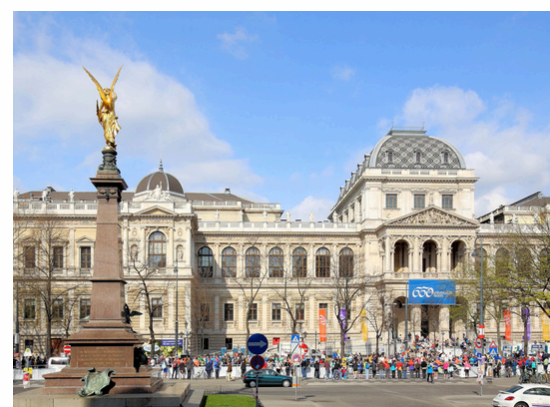
Université de Vienne Vienne - Autriche