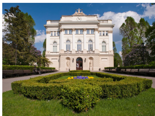
Université de Varsovie Varsovie - Pologne