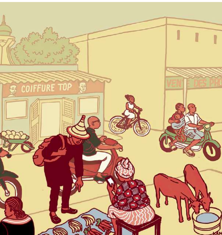
Illustration réalisée pour le MOOC de mooré par l'artiste Annick Kamgang

Grâce à ce programme, l'Inalco contribue non seulement à préserver et diffuser une langue à forte vitalité en Afrique de l'Ouest, mais aussi à élargir l'accès à un patrimoine immatériel essentiel , encore largement absent des espaces éducatifs et numériques internationaux.