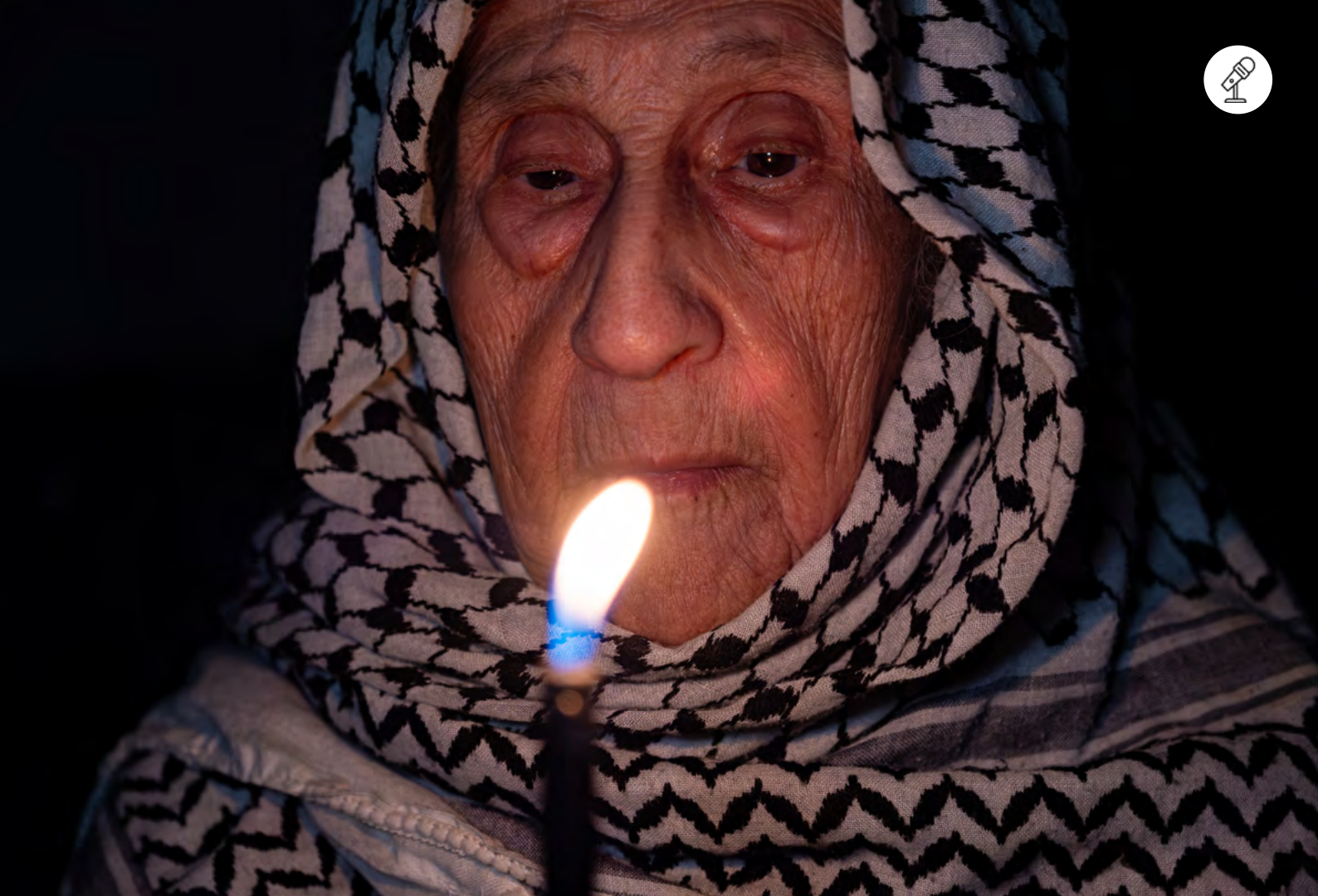
Portrait d'une vieille dame portant un keffieh palestinien

27 février - 19h-21h30 Pôle des langues et civilisations - Auditorium