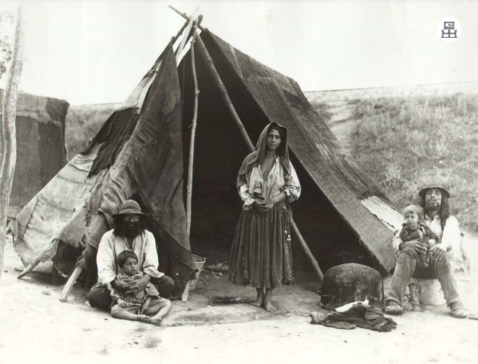
Roms kaldérash dans l'entre-deux-guerres