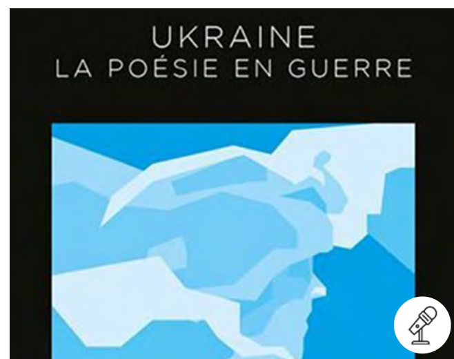
Le guerrier Khmara, 2023 © Nikita Titov

Plus d'informations sur www.inalco.fr/agenda Entrée libre.