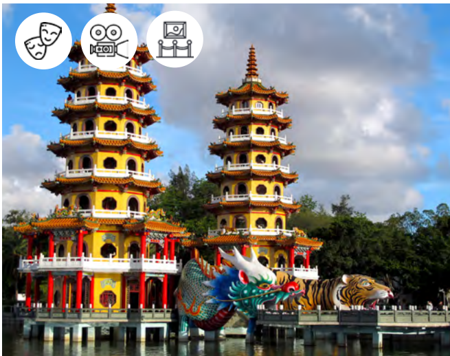
The dragon and tiger pagodas