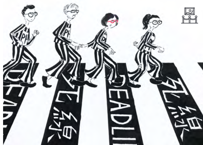
Permanent Head Damage – PhD © Xinyue Cécilia Yu

Plus d'informations et programme complet sur www.inalco.fr/agenda . Entrée libre.