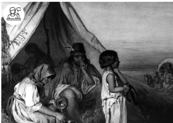
Gypsy Family before a Tent © Johann Baptist Wengler

20 février - 10h30-19h30 Pôle des langues et civilisations - Auditorium