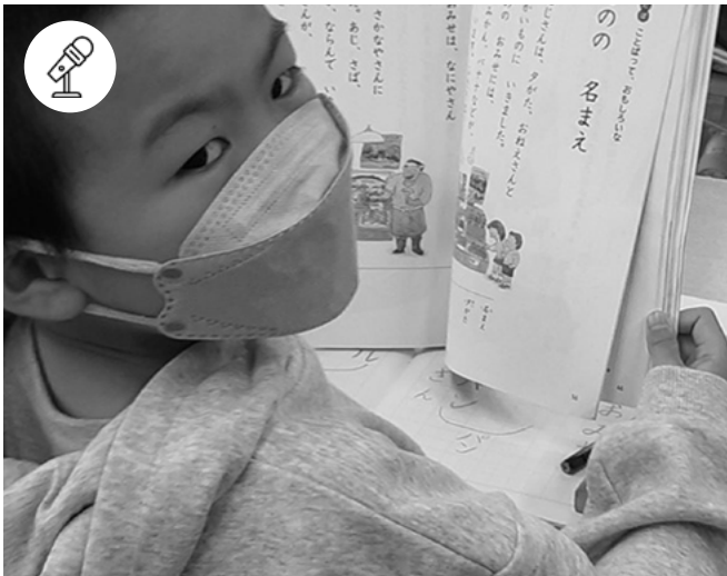
Ecole japonaise

6 janvier - 17h-18h15 Maison de la recherche - Salle Silvestre de Sacy