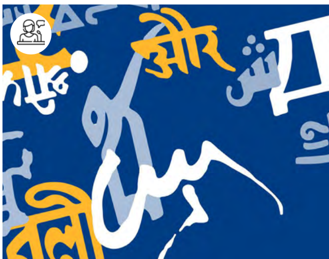
Écritures orientales

17 janvier - 9h-18h Centre Panthéon Sorbonne - Salle 1