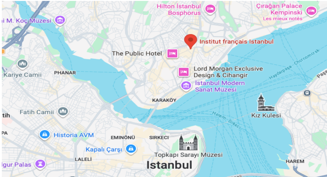
Institut Français, Taksim, İstiklal Caddesi, No: 4, 34435 Beyoğlu - İstanbul