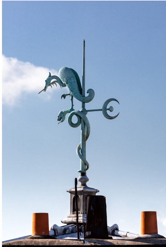
La girouette de l'INALCO