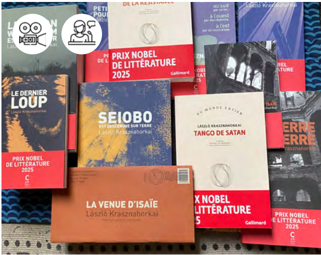
Couvertures d'ouvrages de László Krasznahorkai

26 mai - 15h-21h30 Pôle des langues et civilisations - Auditorium