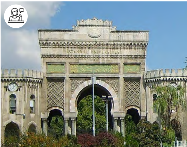
Université d'Istanbul

21 et 22 mai - 9h-17h30 Istanbul, Turquie (Université d'Istanbul et Institut français)