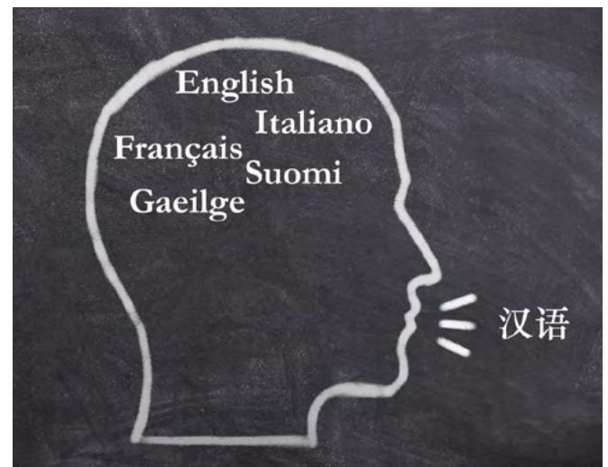
Workshop photo © Image par Adrian de Pixabay