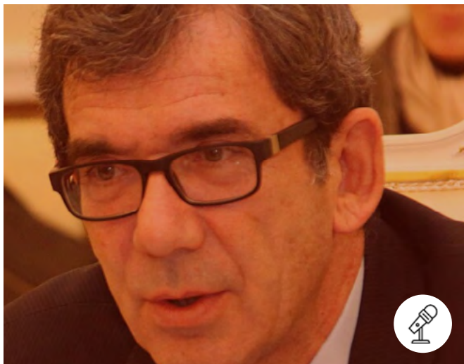
L'avenir du multilatéralisme : la France doit-elle garder sa voix singulière ?