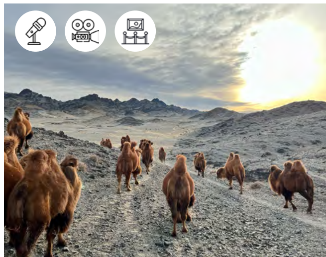
Un troupeau de chameaux de Bactriane retourne au campement. Désert de Gobi, Mongolie.

11 mai - 18h30-20h 12 mai - 9h30-19h 13 mai - 9h30-17h Pôle des langues et civilisations