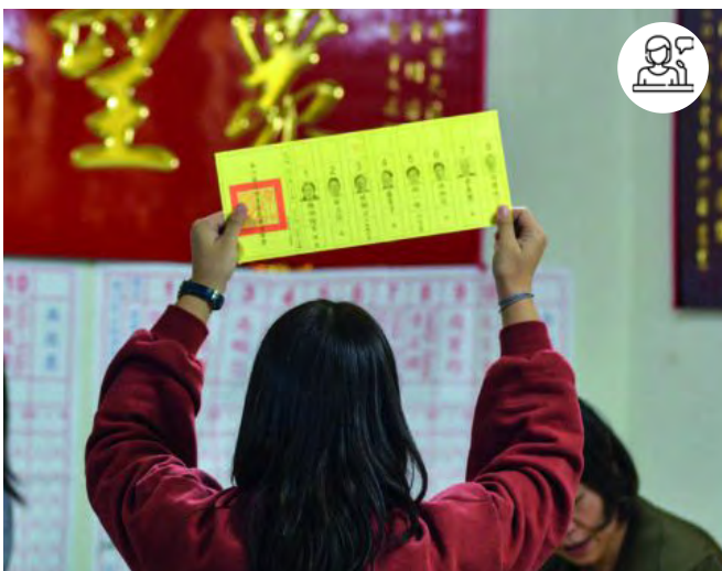
Couverture du livre Taiwan : une démocratie face à la Chine © Editions Le Cavalier Bleu