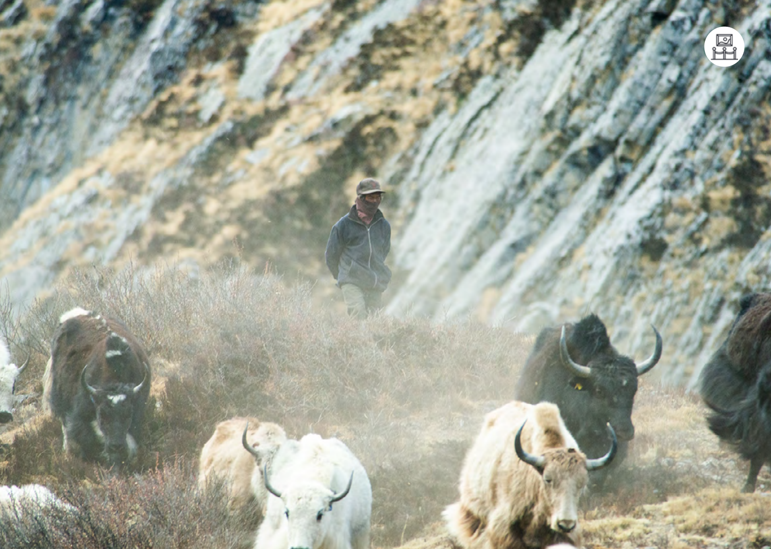
Berger et ses yaks au Népal.