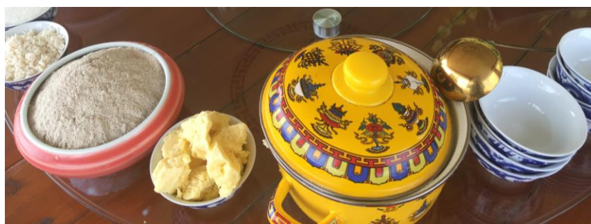
Fromage séché, tsampa et beurre, août 2023