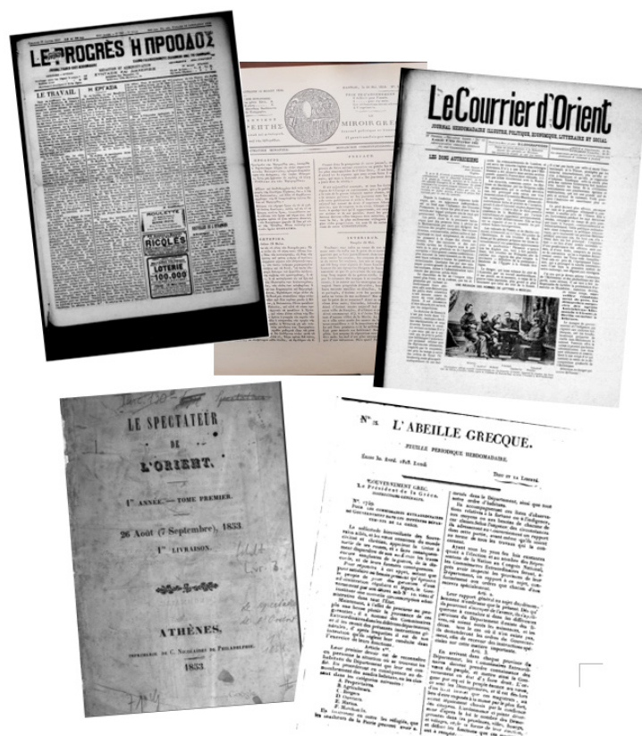
Une de journaux francophones publiés en Grèce au XIXe siècle (Le Progrès, Le Courrier d'Orient, Le Spectateur d'Orient, l'Abeille grecque)