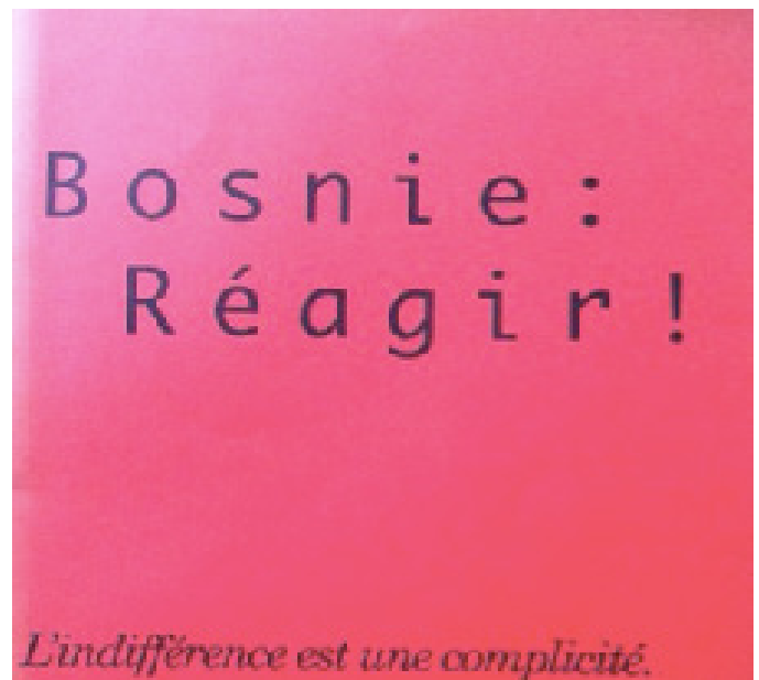
Extrait de la couverture de la publication associative " Bosnie Réagir ! ", Paris, mai -juin 1993, numéro unique, directeur de publication Mathias Gérard

Vendredi 10 mai 2019 10h00-12h00 Salle 4.17 Inalco 65 rue des Grands Moulins 75013 Paris