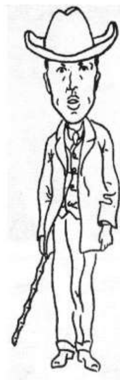
Karel Čapek jde na procházku (Autokarikatura) [Karel Čapek part en promenade (Autocaricature)], Rozpravy Aventina , vol. I, n° 1, sept. 1925, p. 1.