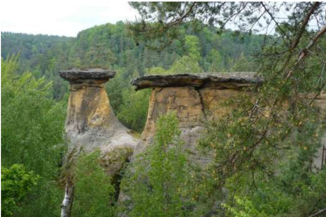
« Ville de rochers » près de Mšeno (Bohême centrale)