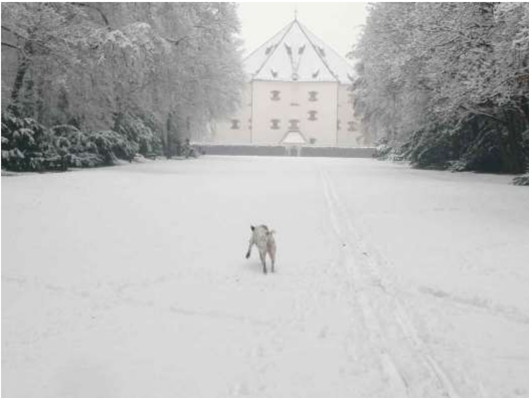
Prague, Pavillon Hvězda