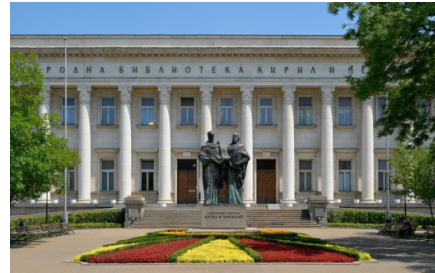
Bibliothèque nationale « Saints Cyrille et Méthode », Sofia.

Au IX e siècle, les événements et la clairvoyance politique de ses souverains ont permis au Royaume de Bulgarie d'accueillir les disciples des frères Cyrille et Méthode, créateurs des alphabets slaves, et d'être ainsi le berceau de la première langue littéraire slave et de la première littérature écrite dans cette langue – faite d'abord de traductions de textes sacrés et liturgiques, puis d'œuvres originales. À partir de là, elles allaient être diffusées en Serbie, dans la Russie de Kiev.