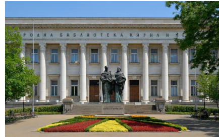
Bibliothèque nationale « Saints Cyrille et Méthode », Sofia.

Au IX e siècle, les événements et la clairvoyance politique de ses souverains ont permis au Royaume de Bulgarie d'accueillir les disciples des frères Cyrille et Méthode, créateurs des alphabets slaves, et d'être ainsi le berceau de la première langue littéraire slave et de la première littérature écrite dans cette langue – faite d'abord de traductions de textes sacrés et liturgiques, puis d'œuvres originales. À partir de là, elles allaient être diffusées en Serbie, dans la Russie de Kiev.