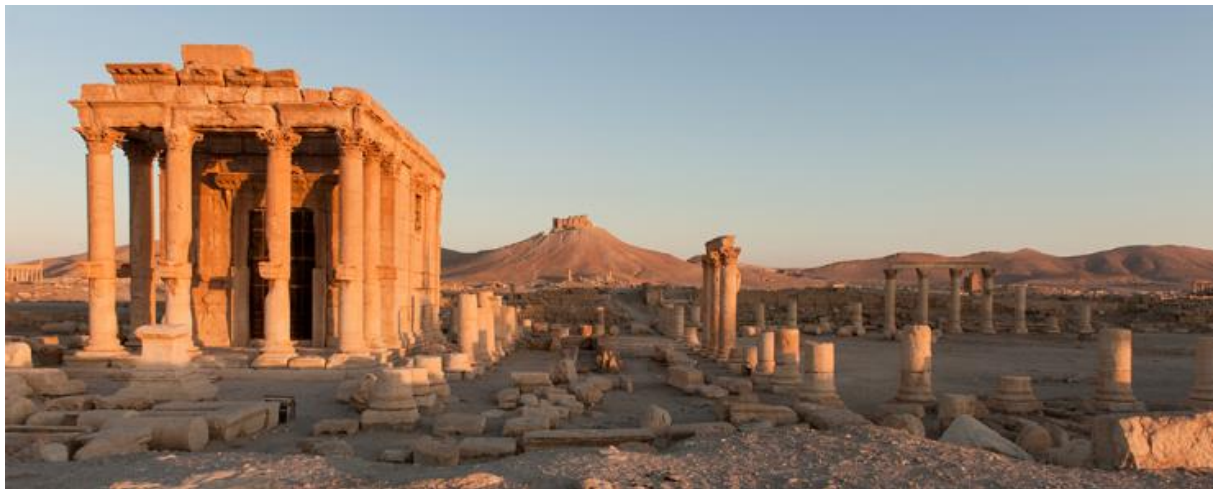
Vue de Palmyre (Tadmor)

http://www.inalco.fr/actualite/ouverture-carnet-recherche-hypotheses-seminaire-patrimoines-politiques-memorielles