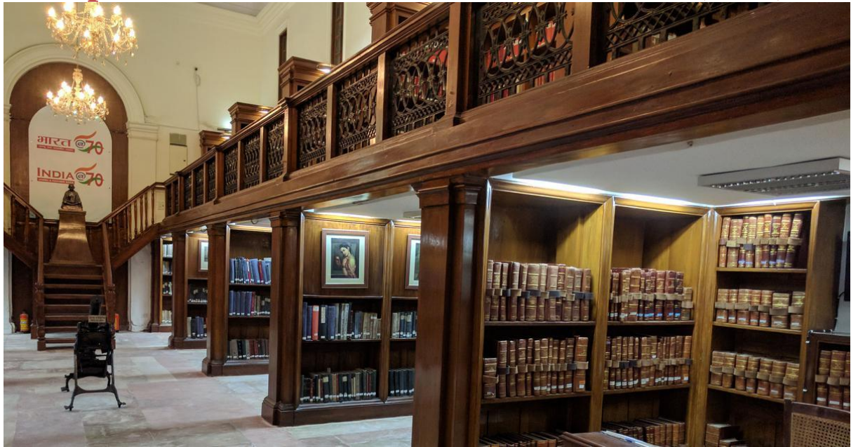
Archives Nationales de la république fédérale de l'Union Indienne à New Delhi. En 2023, l'Inde est devenue le pays le plus peuplé au monde.