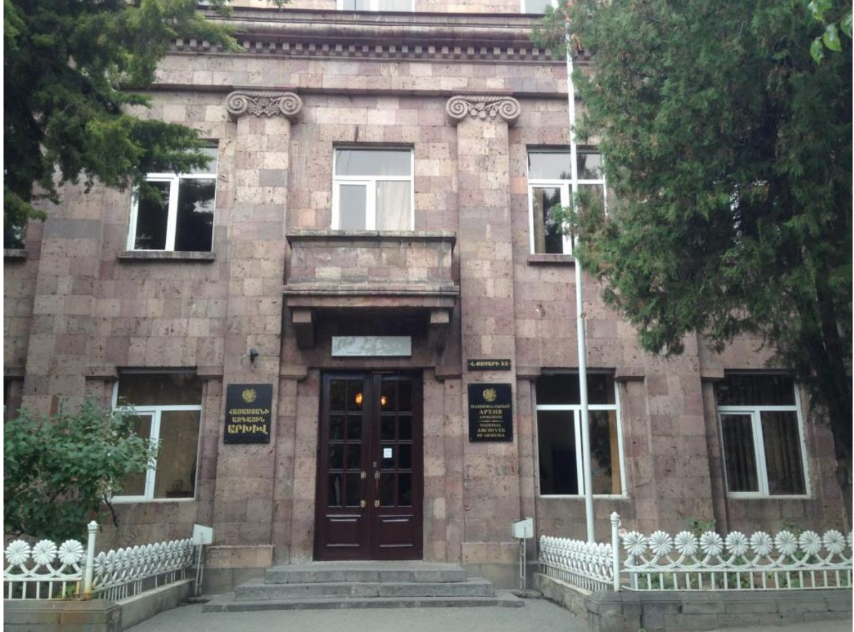
Archives Nationales de la République d'Arménie. L'Arménie est le plus petit Etat du Caucase-Sud.