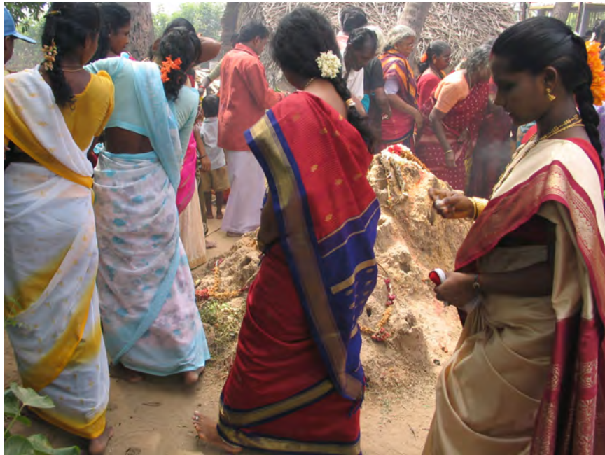
Scène de culte, Cīrkālī (U. Veluppillai, 2006)

Ce cursus s'adresse à toute personne désireuse d'acquérir une compétence en langue, sans s'engager dans un cursus de licence, notamment, les étudiants ayant déjà acquis une formation diplômante de type licence ou master ou engagés par ailleurs dans ce type de cursus. A noter que les étudiants ayant validé les trois premiers niveaux du DLC peuvent à tout moment compléter leur formation en validant l'UE3 des Enseignements régionaux et l'UE4 des Enseignements libres et obtenir une licence. En effet, le contenu des trois premiers niveaux du DLC correspond strictement aux enseignements fondamentaux (UE1 et UE2) du cursus de licence.