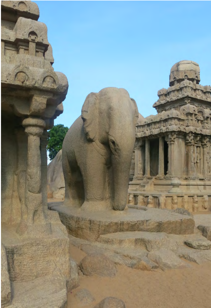
Monuments monolithiques de Mahābalipuram (U. Veluppillai, 2014)