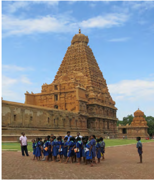
Temple de Bṛhadīśvara, Tañcāvūr (U. Velupillai, 2014)

Brochure non contractuelle, à jour au 2 septembre 2019. Des modifications sont susceptibles d'intervenir d'ici la rentrée.