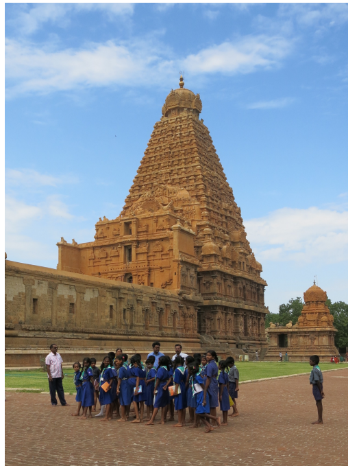
Temple de Bṛhadīśvara, Tañcāvūr (U. Veluppillai, 2014)

Brochure non contractuelle, à jour au 28 mars 2023. Des modifications sont susceptibles d'intervenir d'ici la rentrée.