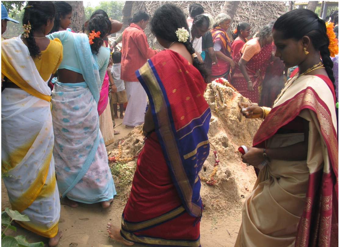
Scène de culte, Cirkāji (U. Velupillai, 2006)