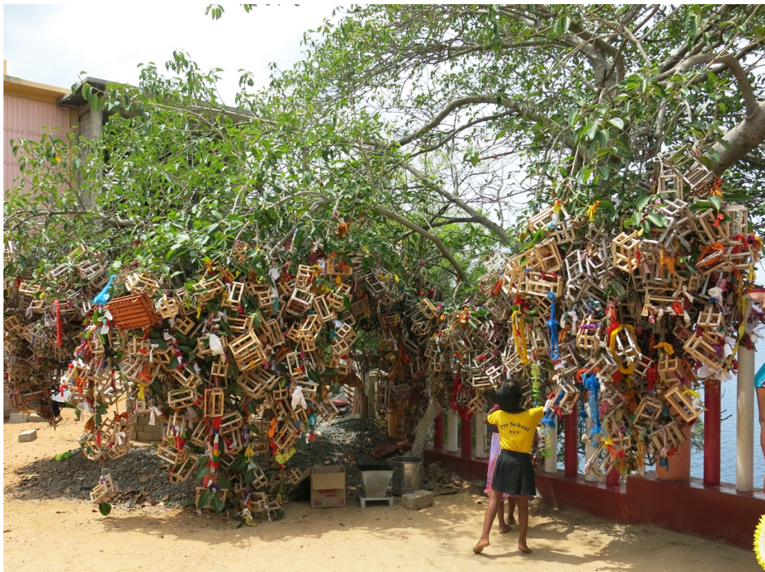
Arbre à vœux sur lequel sont attachés des berceaux miniatures, Tirukōṇamalai

http://www.inalco.fr/formations/faire-rentree-inalco