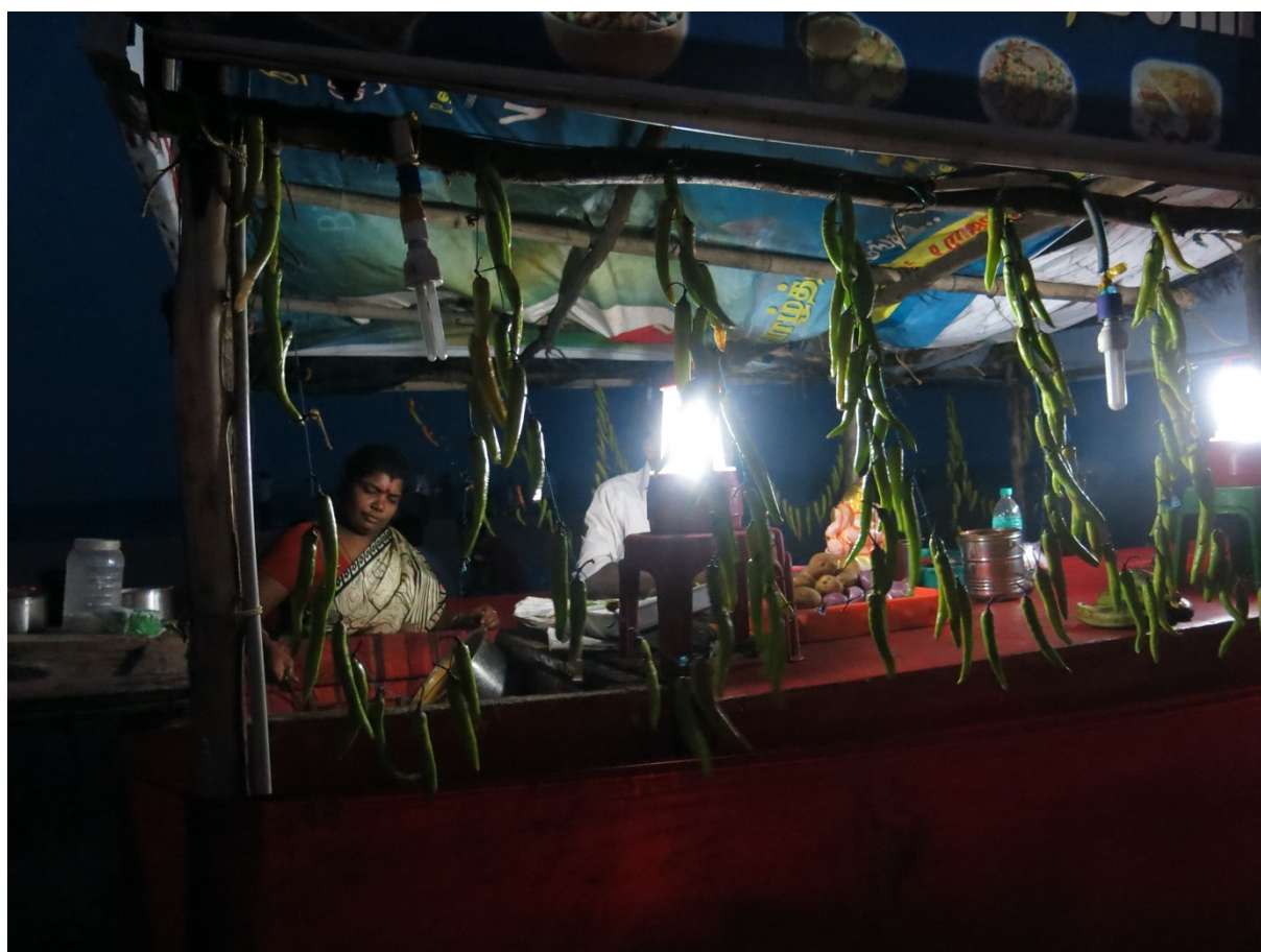
Vendeurs de bajji, Cennai (U. Veluppillai, 2014)