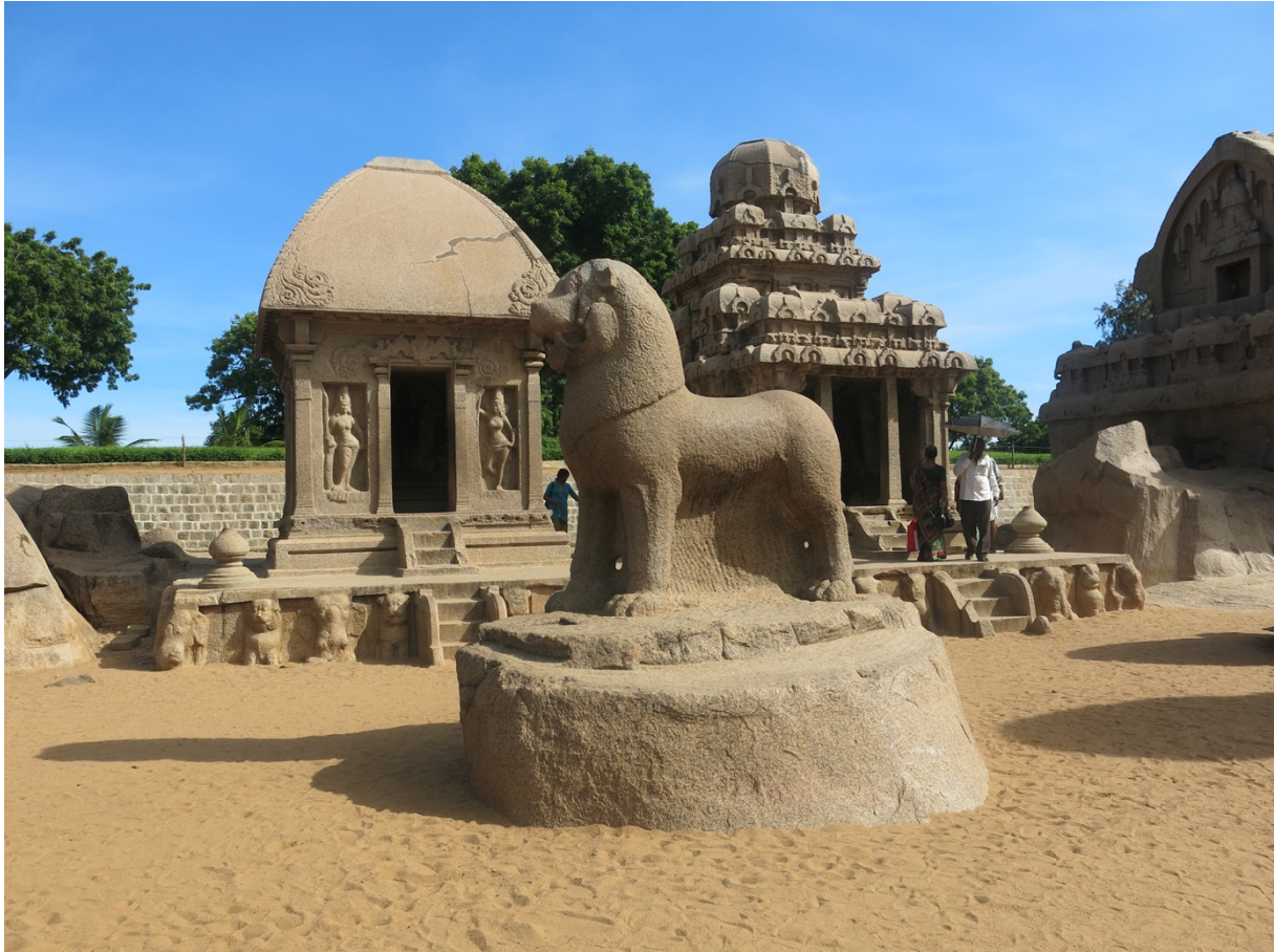
Monuments monolithiques de Mahābalipuram (U. Veluppillai, 2014)

La présente brochure décrit la licence LLCER (« Langues, littératures et civilisations étrangères et régionales ») de tamoul. Le tamoul peut également être suivi dans le cadre de diplômes d'établissement (sur 3 niveaux) ou dans le cadre du Passeport Langues O' , une formation non diplômante permettant aux bacheliers de valider jusqu'à 8 cours dans l'année universitaire. Cette formation est ouverte aussi aux non-bacheliers, mais sans possibilité de validation.