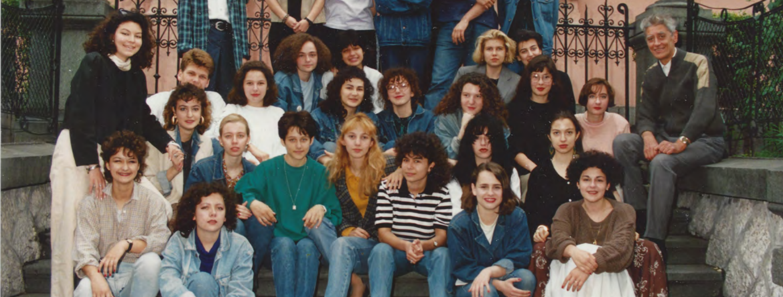
Les lauréats