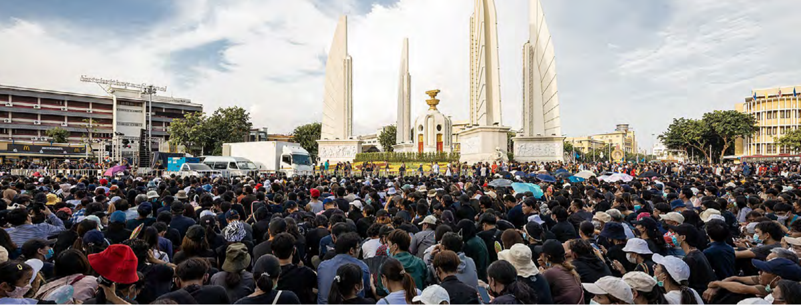
The protests on August 16, 2020 in a large demonstration organized under the Free Youth umbrella (Thai: เยาวชนปลดแอก; RTGS: yaowachon plot aek) at the Democracy Monument in Bangkok.