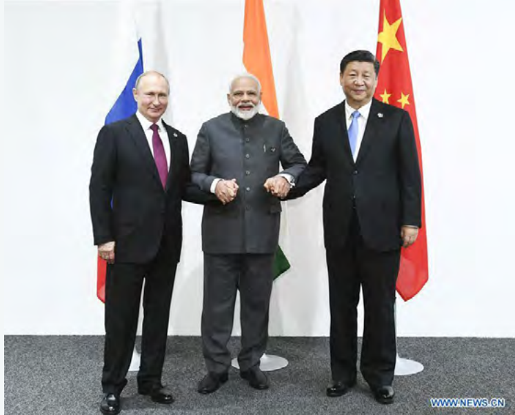
Vladimir Poutine, Narendra Modi, Xi Jinping