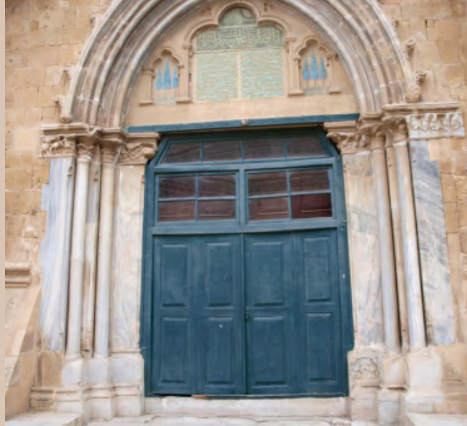
Église latine devenue mosquée à Nicosie