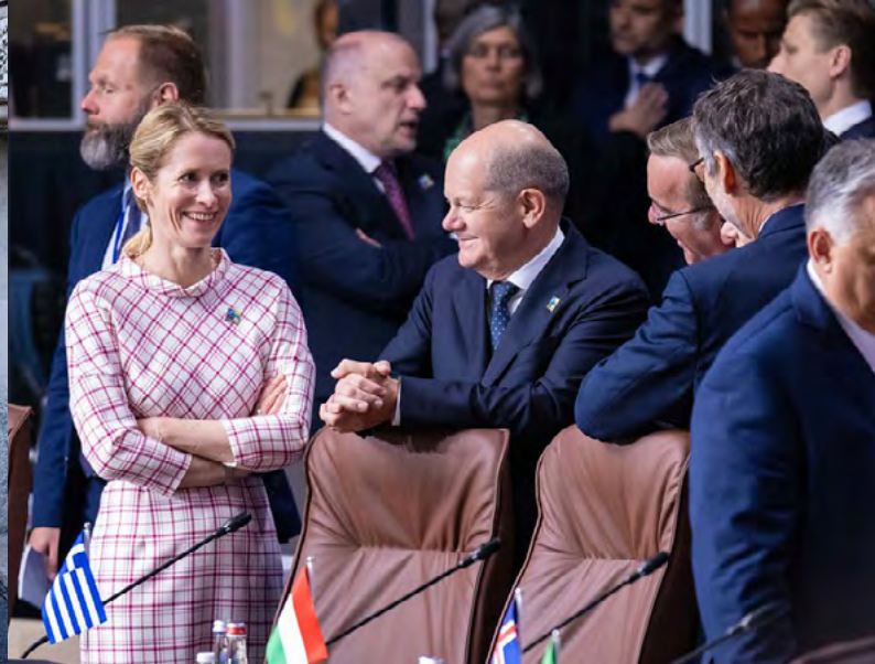
A gauche : Les membres de la coalition gouvernementale finlandaise. A droite : La Première ministre estonienne, Kaja Kallas, et le Chancelier allemand, Olaf Scholz au Sommet de l'OTAN à Vilnius