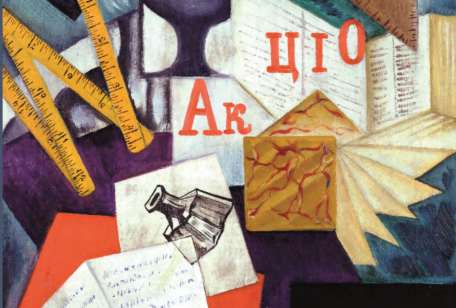
Olga Rozanova, Bureau (fragment), 1915