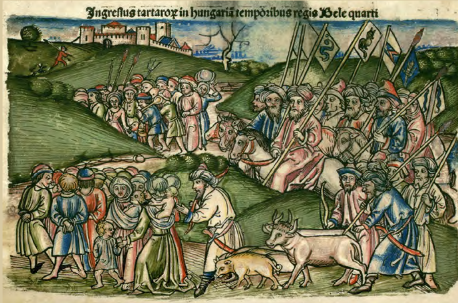
Chronica Hungarorum - First Mongol invasion of Hungary