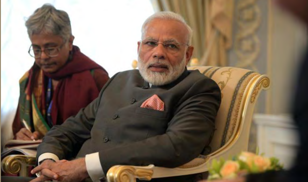
Prime Minister Narendra Modi and President Vladimir Putin meeting on the sidelines of the St Petersburg International Economic Forum.